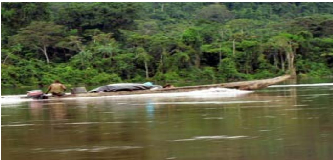
Slika 6.12: Tradicionalni kanuji z bencinskimi motorji so vez z zunanjim svetom