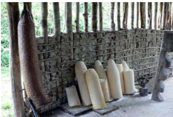
Slika 6.9: Stisnjena kaša juke