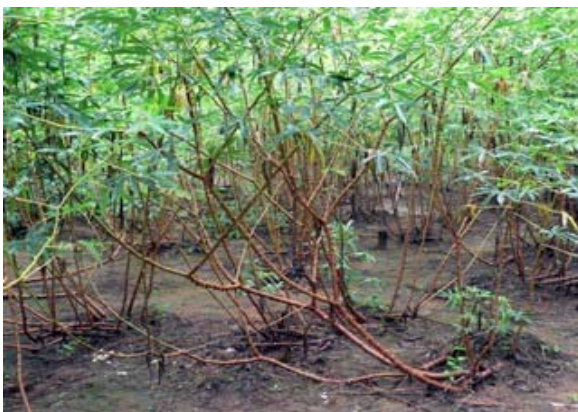
Slika 6.7: Juka ali manioka