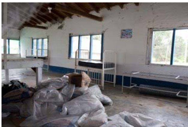
Slika 6.13: Bolnišnica v yekuanski vasi