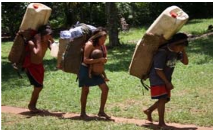
Slika 5.4: Sanema so pol-nomadsko ljudstvo