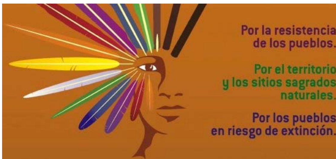
Slika 9.1: Ena od objavljenih grafik na Facebook strani Organizacion Kuyujani