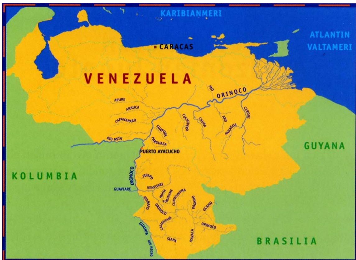
Slika 4.2: Venezuela s porečjem Orinoka in Caure