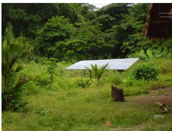
Slika 6.3: Fotovoltaične celice v yekuanski vasi