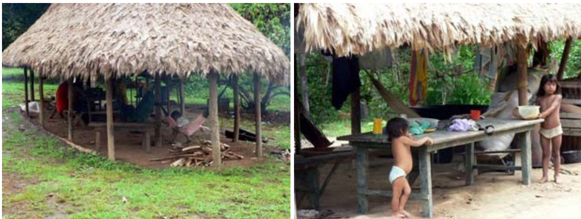
Slika 6.5 in 6.6: Preprosto življenje v yekuanski vasi