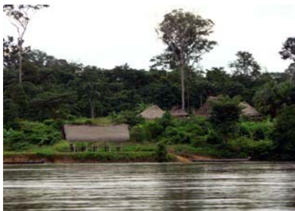
Slika 5.1: Indijanska vas ob reki Cauri