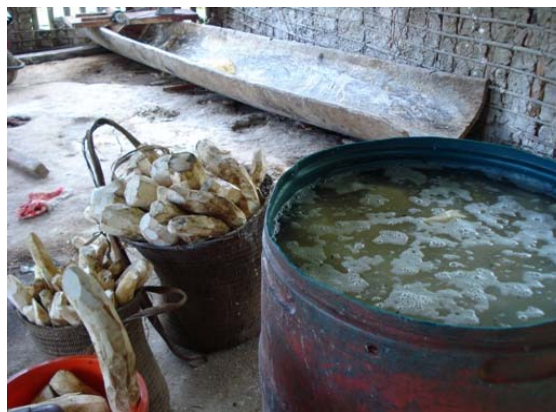
Slika 6.8: Namočeni gomolji juke