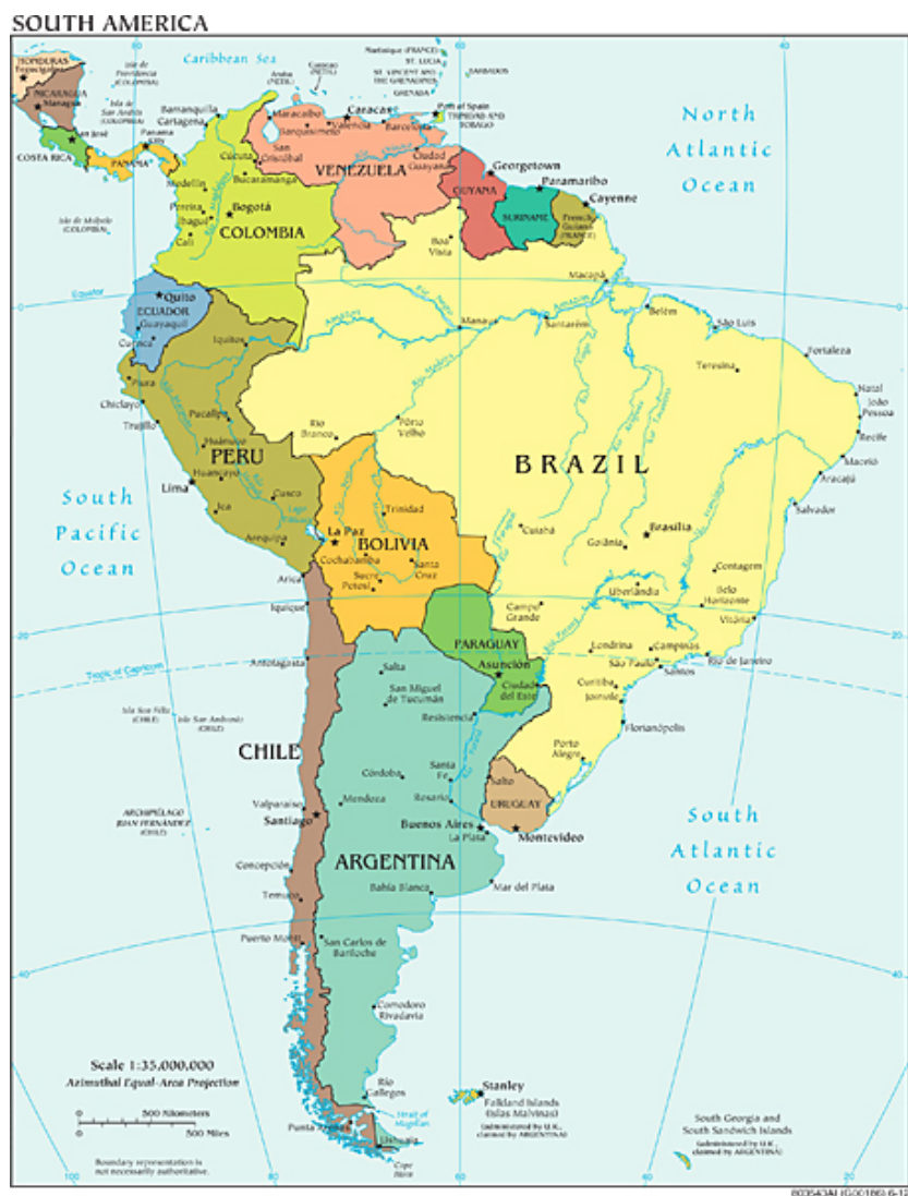
Slika 4.1: Južna Amerika z Venezuelo na severu