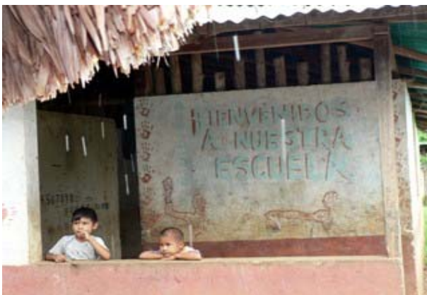
Slika 6.14: Šola v vasi ljudstva Yekuana