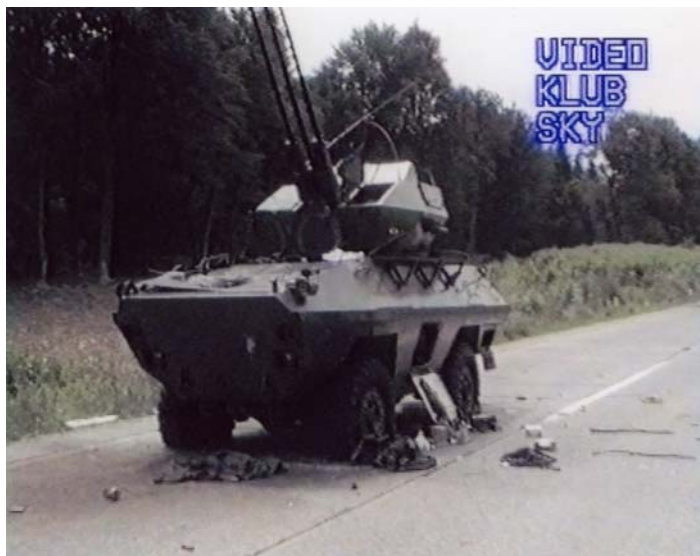
Slika 4: Uničenje vozila JLA BOV-3 v Krakovskem gozdu