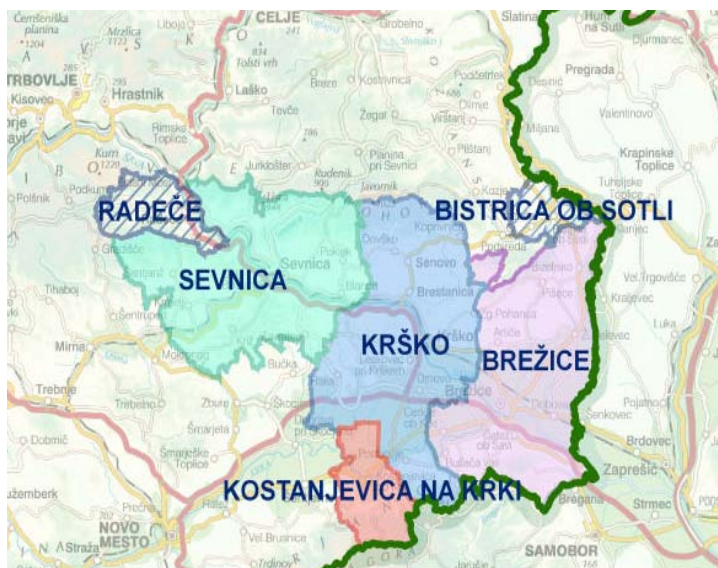
Slika 1: Posavje na zemljevidu Slovenije in njegove občine

Posavje je statistična slovenska pokrajina v jugovzhodnem delu Slovenije tik ob meji s Hrvaško. Razprostira se ob spodnjem toku reke Save in ob njenih pritokih na strateški smeri Panonska nižina – Padska nižina. Obsega Savsko dolino, vzhodni del Krške kotline do Sotle, jugovzhodni del Posavskega hribovja, severovzhodni del Gorjancev, Krško, Senovsko in Brežiško gričevlje. 34 Meji na Zasavsko in Savinjsko regijo ter regijo Jugovzhodna Slovenija. V Posavju je danes šest občin: Sevnica, Krško, Brežice, Kostanjevica na Krki, ki je bila do leta 2006 del krške občine, Radeče in Bistrica ob Sotli, ki sta se regiji priključili leta 2007 zaradi razvojnih interesov. Regija zavzema 968,2 km 2 površine, kar predstavlja 4,77 % celotnega slovenskega ozemlja. S tem se uvršča med najmanjše slovenske regije. V njej živi 3,8 % vsega slovenskega prebivalstva v skupno 443 naseljih. 35