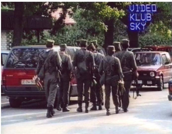
Slika 2: Pripadniki intervencijskega voda TO Brežice pred odhodom v Rigonce