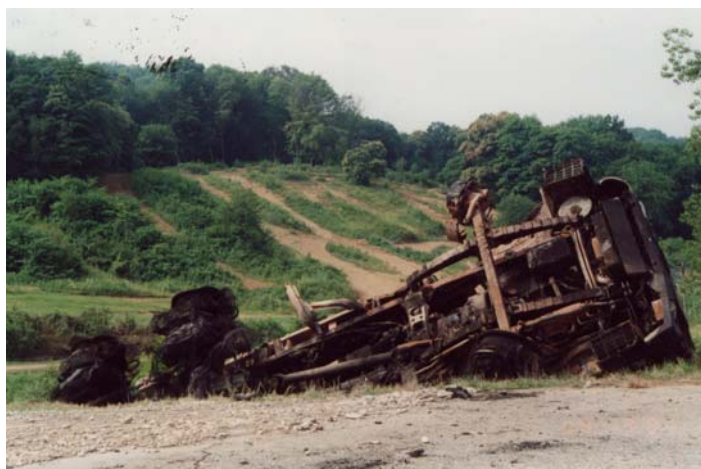
Slika 5: Uničen kamion v Prilipah