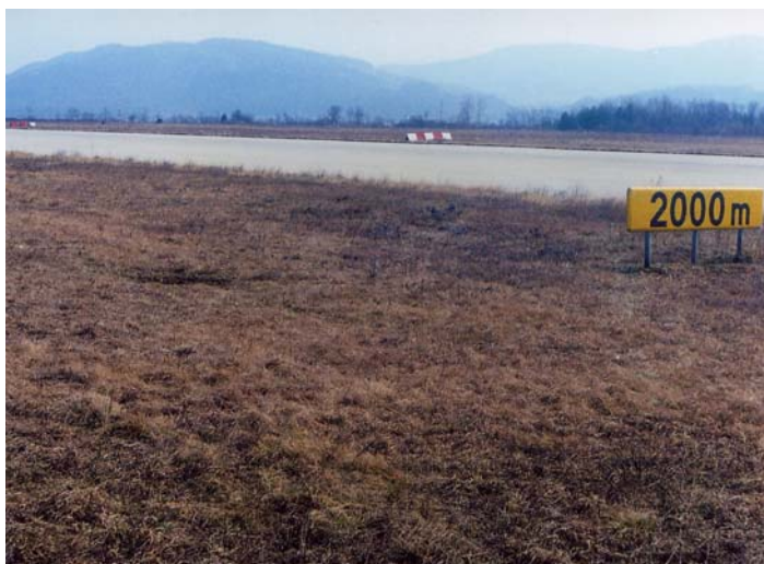
Slika 3: Območje vzletno pristajalne steze, ki sta jo zadeli minometni mini