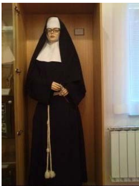
Slika 5.2: Habit, kakršnega so nekoč dobile sestre ob večnih zaobljubah (do 2. vatikanskega koncila)