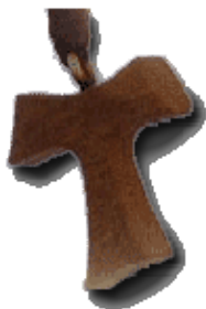
Slika 3.1: Frančiškov križ tau