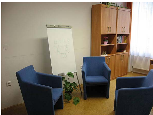
Slika 8.1: Družinski center MIR