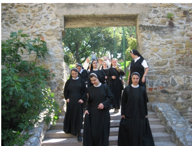
Slika 5.1: Obleka šolskih sester danes