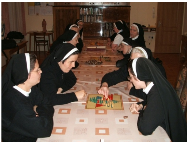
Slika 8.2: Rekreacija šolskih sester