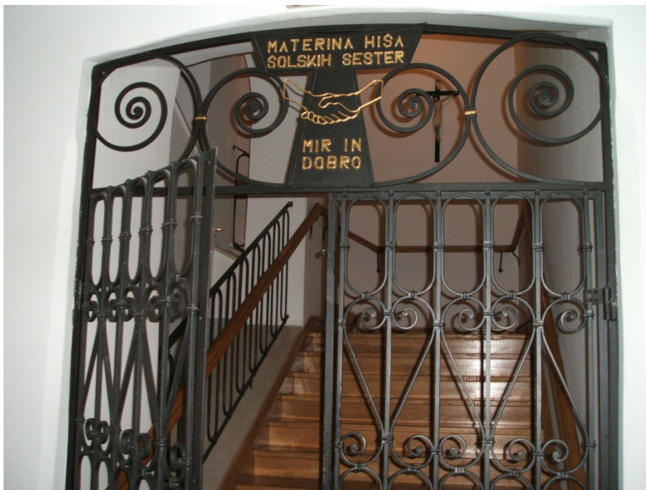
Slika 2.1: vhod v samostan šolskih sester na Strossmayerjevi 17 v Mariboru