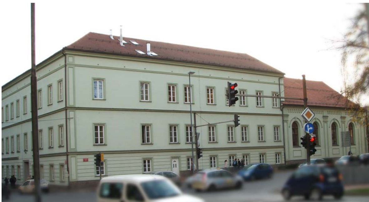
Slika 5.4: Stavba matrne hiše kongregacije šolskih sester.