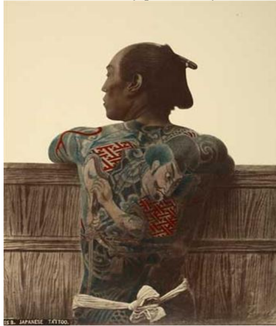
Slika 3.9: Tradicionalna japonska body-suit tetovaža

značilno poslikano celo telo z večbarvnimi miniaturnimi podobami, ki dajejo vtis umetnosti. Vpeljali so efekte senčenja in reliefnosti, preciznosti in natančnosti. Nekateri vzorci so postali popolnoma vidni šele, ko so jih premazali z alkoholom ali v topli kopeli. Z napenjanjem mišic in premikanjem telesa so tetovaže dajale vtis živosti, gibanja. (Cohen 2000, 96) Tukaj ima tetoviranje pretežno estetski, mitski, dekorativni namen v navezi z božanstvom, naravo in človeštvom.