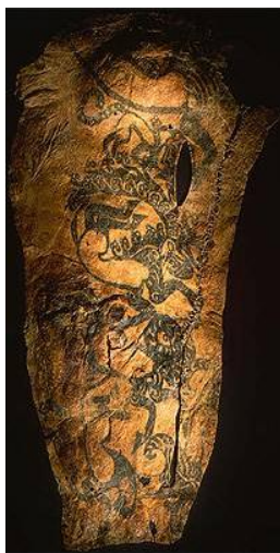
Slika 3.1: Tetovaža na desni roki mumije izpred 2500 let, najdene v Rusiji

Na podlagi najdenih orodij, kot so statve iz žgane gline, raznih instrumentov, ki so jih uporabljali pri izdelavi tetovaž, in sledih železovega, manganovega oksida na kosteh paleolitskih okostij lahko domnevamo, da so proces tetoviranja poznali že v obdobju prazgodovine. To dokazujejo tudi odkritja kipcev v različnih predelih sveta iz leta 4500-3500 p. n. št., na katerih so dobro opazni znaki tetoviranja, ki se kažejo kot okras na prsih, okončinah, obrazu.