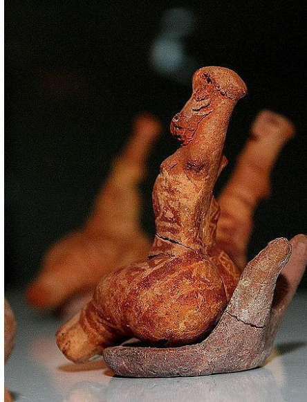
Slika 3.2: Glinena figurica (4900-4750 p. n. št.) najdena na današnjem območju Romunije