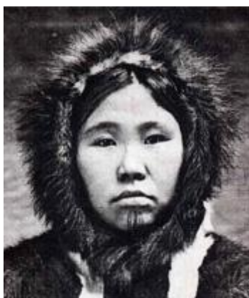
Slika 3.10: Tradicionalna tetovaža eskimskih žena