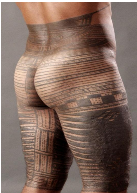
Slika 3.6: Tradicionalna samoanska tetovaža - hlače