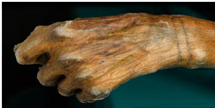
Slika 3.3: Tetovaže na roki Ötzi