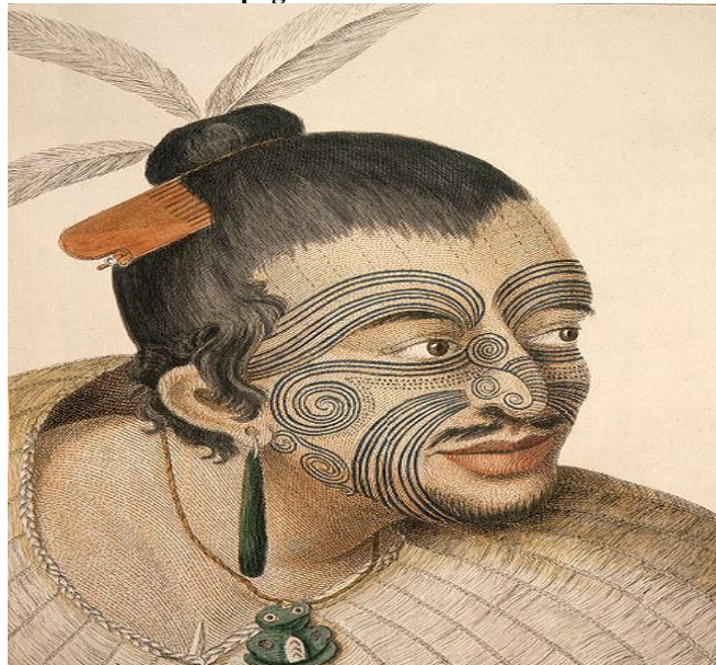
Slika 3.8: Maorski poglavar z značilnimi moko tetovažami

Ko je kapitan Cook s svojo ladjo Endeavour prispel na Novo Zelandijo, se je srečal z visoko razvito, tradicionalno obliko tetoviranja Maorov, ki jo še danes imenujejo moko, kajti izraza tetoviranje ne poznajo. Zapisal je, da ima vsako pleme posebej svoje različne navade, obrede, motive tetoviranja. Telesa in celoten obraz so bili prekriti s spiralnimi linijami, krogi, udolbnjenimi linijami, narejenimi z umetniško natančnostjo in potrpežljivostjo. Moko je predstavljal povezanost z družinskimi predniki in pripadnost družini.