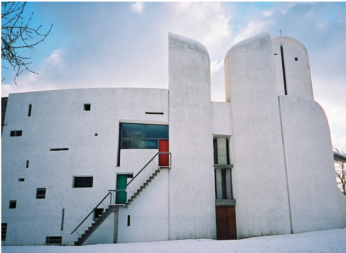
Slika 4.4.2: Le Corbusierjeva kapela Notre-Dame-du-Haut v Ronchelu.

fazi individualnosti. Dialeksična medigra, ki jo zariše Benjamin kot konstitutivno za razvoj mesta in njegovega prebivalca, v njegovih predpostavkah umanjka. Kontradiktorno je seveda to, da odsotnost pluralnosti in kaotičnosti izmakne sama tla modernosti kot kulturne senzibilnosti. Le Corbusierjevo stremenje je pravzaprav izrazito faustovsko. Cilj »svobodnih ljudi na svobodnih tleh« preko ukrotitve moči narave je Faust uresničeval z zaslombo avtoritarnih političnih sil, saj naj bi emancipacija izšla iz novega stanja. Ista predpostavka je očitno vodila tudi Le Corbusierja, ki je koketiral tako z Mussolinijem kot pozneje s Vichyskim režimom v Franciji in obenem trdno veroval v demokracijo. O tem razpravlja Charles Jencks, ki modernistično arhitekturo vidi v tem dvojnem kontekstu avtoritarnosti in svobode. Po njegovem je sama arhitektura določila svobodo gibanja in sicer v skladu s »popolno instrumentalizacijo življenja, ki bi jo teoretiki modernega življenja, od Jeremya Benthamu do Maxa Webra dobro razumeli – nadzorom« (Jencks 1992: 12).