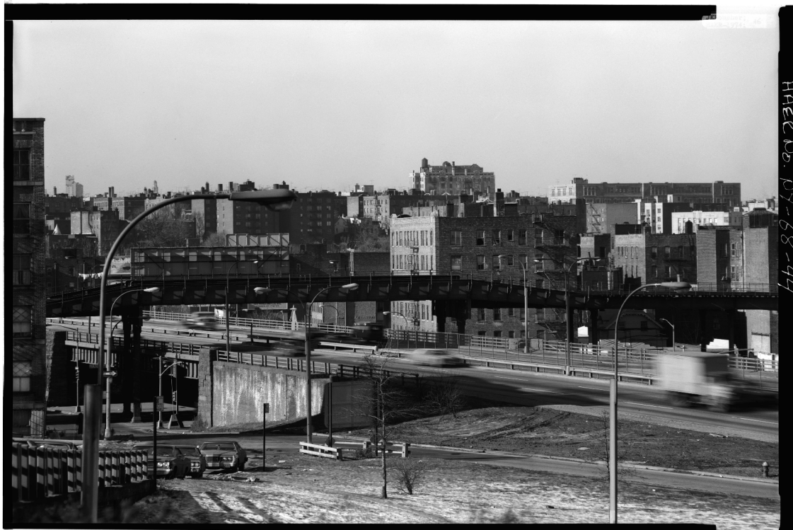
Slika 4.3.2: Podoba Bronxa po Mosesovi implementaciji hitre ceste.

zapuščenih stavb ter v nasmeteno opečnato divjino transformiranih sosesk» (Ibid. 290). Selitev 60.000 prebivalcev se je Mosesu zdela zanemarljiv strošek za uresničitev njegove vizije. »Gre le za nekaj nelagodnosti, in še ta je pretirana«, je dejal. »Več stavb je v napoto...več ljudi...to je vse« (Ibid. 293). Posledice so bile, tako Berman, uničena kakovost bivanja, poškodovana socialna omrežja, razmajani kognitivni zemljevidi in ekonomski kolaps.