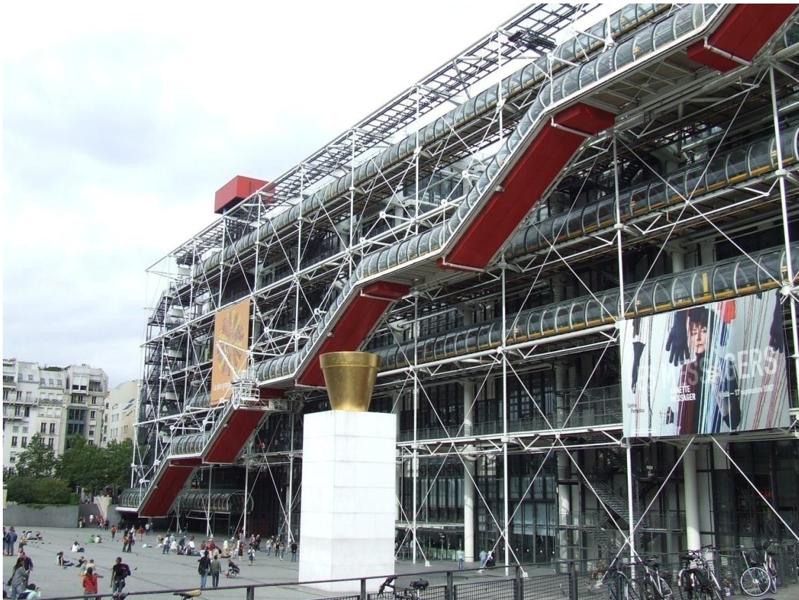
Slika 6.3.1: Center Georges Pompidou.