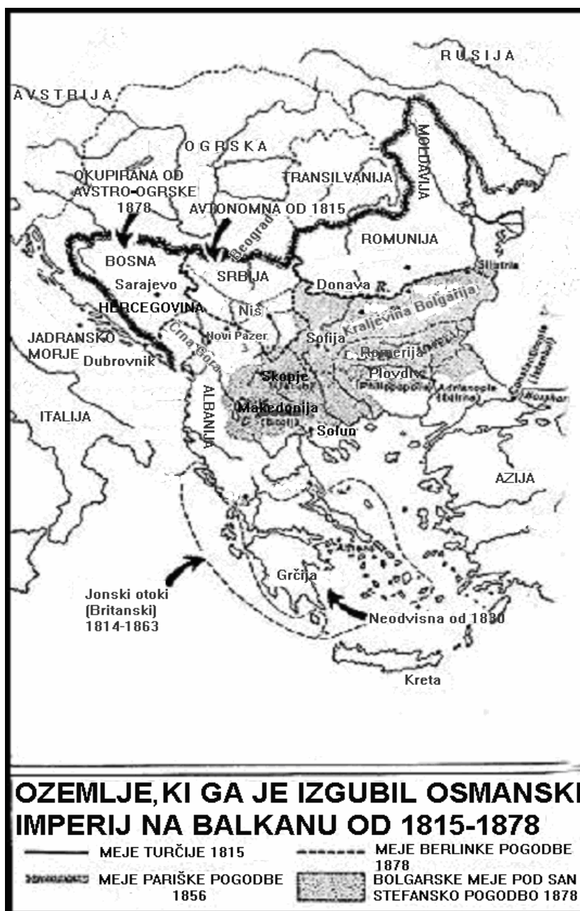
SLIKA 5.9 OZEMLJE, KI GA JE IZGUBIL OSMANSKI IMPERIJ V LETIH 1815-1878

vir: http://www.suc.org/culture/history/berlin78/ott4.html (04)