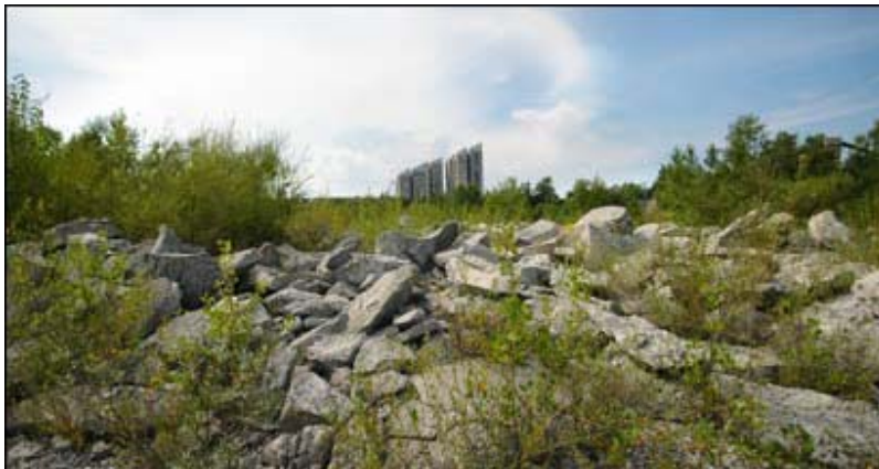
Slika 5.1: Lokacija za stadion v Stožicah

Nekaj utrinkov, kako Ljubljana izgleda danes in kako bo izgledala najkasneje leta 2025.