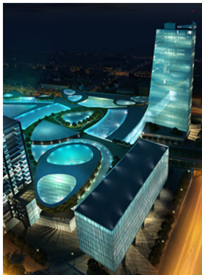
Slika 5.6: Nočni pogled na Emoniko

Emonika bo dolgoročno povezovala slovensko arhitekturno dediščino z inovativnimi, v prihodnost usmerjenimi arhitekturnimi koncepti. Predstavljala bo most med geografsko ločenimi deli mesta. Ustvarjala bo najboljše pogoje za poslovno povezovanje, ki je v sodobnih globalizacijskih tokovih ključ do uspeha. Predvsem pa bo Emonika zagotavljala prostor za povezovanje kultur in za družabno interakcijo v središču Slovenije (Internet 8).