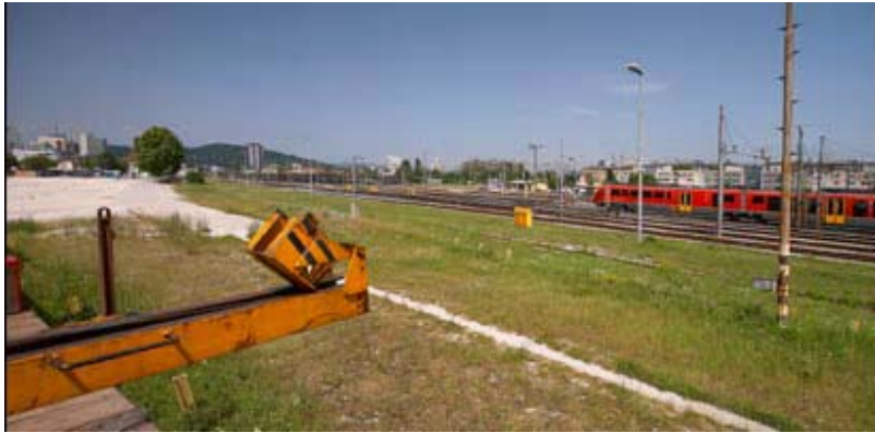
Slika 5.2: Železniška postaja danes