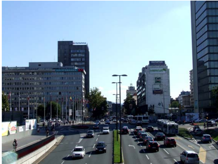
Slika 5.4: Bavarski Dvor danes