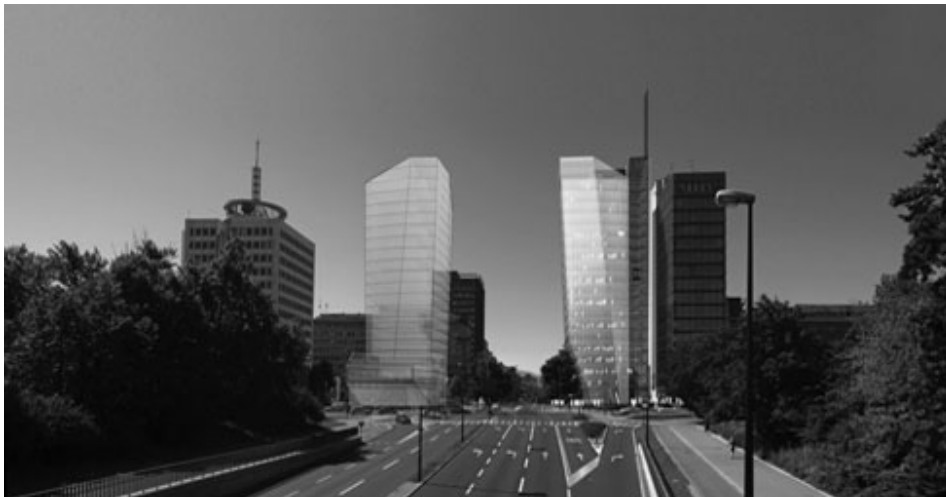
Slika 5.5: Severna vrata