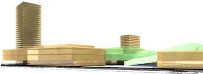
Slika 5.3: Sodobni potniški center Ljubljana