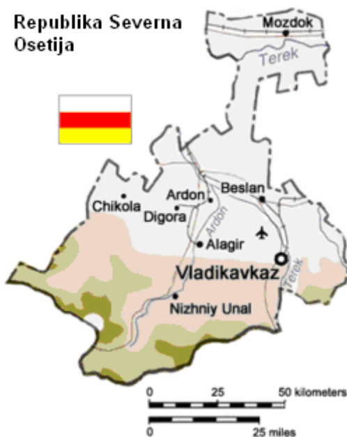
Slika 4.1.1.1: Zemljevid Severne Osetije