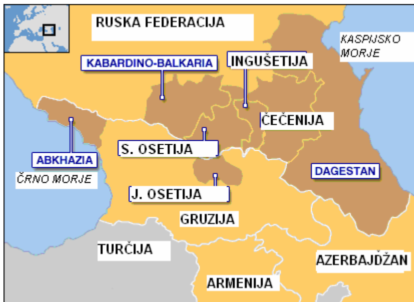
Slika 4.1.1.2: Zemljevid Severnega Kavkaza

Vir: http://news.bbc.co.uk/1/hi/world/europe/3632274.stm , 16. avgust 2006