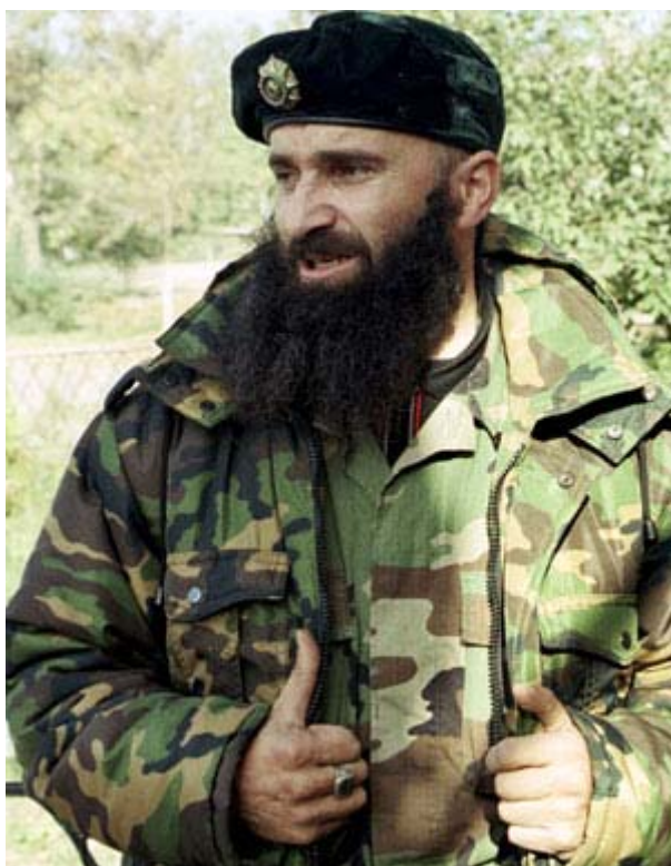
Slika 7.2.7: Šamil Basajev