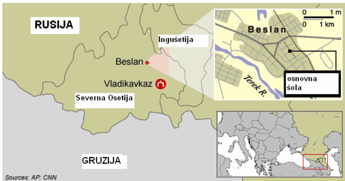
Slika 4.1.2.1.3: Beslan

Vir: http://www.cnn.com/2004/WORLD/europe/09/04/russia.school/ , 19. maj 2006)