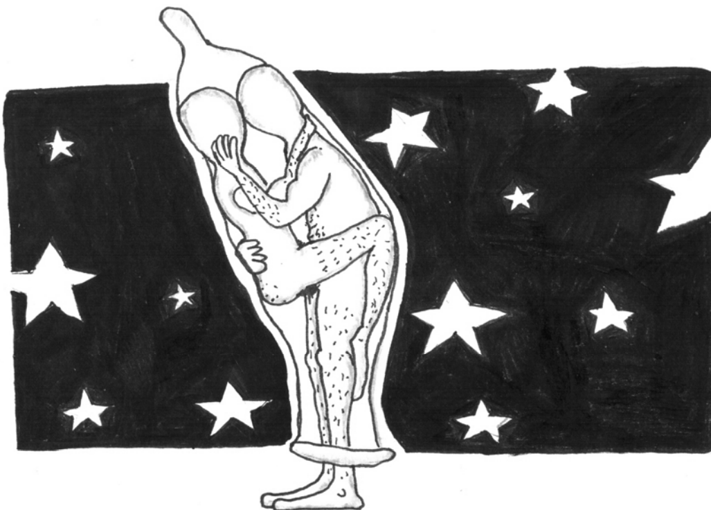
Slika 5.1.4.1: Varen 32 seks?