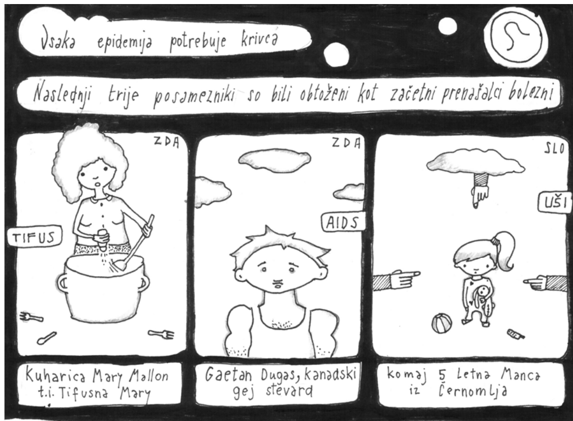
Slika 1.1.1: Kdo je kriv?