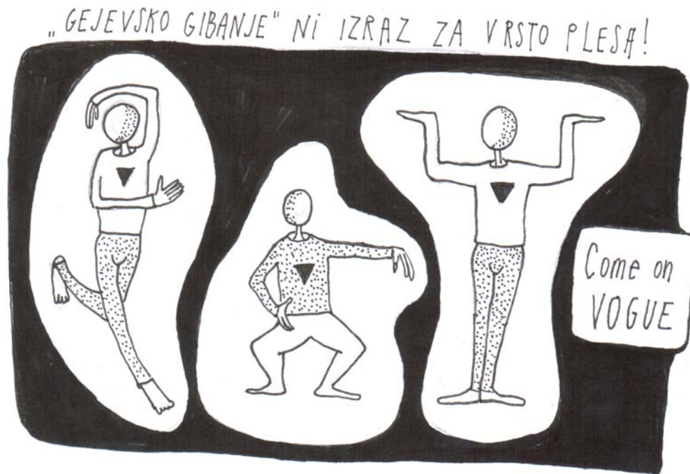
Slika 4.1: Kaj je gejevsko gibanje?