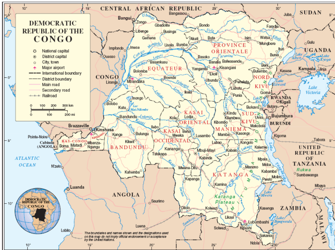
Slika 3.1: DR Kongo