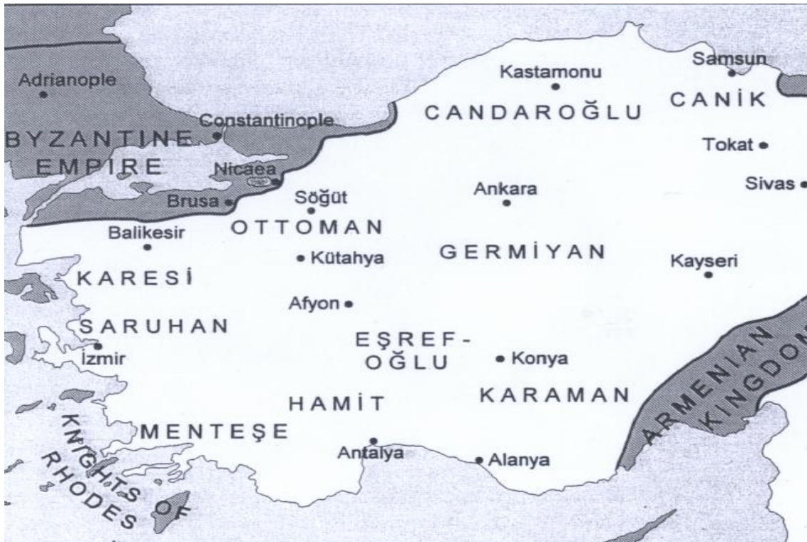
Slika 3: Turški bejliki v Anatoliji 67 .

mongolska oblast. Nobena turška državnica ni bila večja sila v svetu, njihova številčnost je razdruževala vojaško moč Turkov 66 .