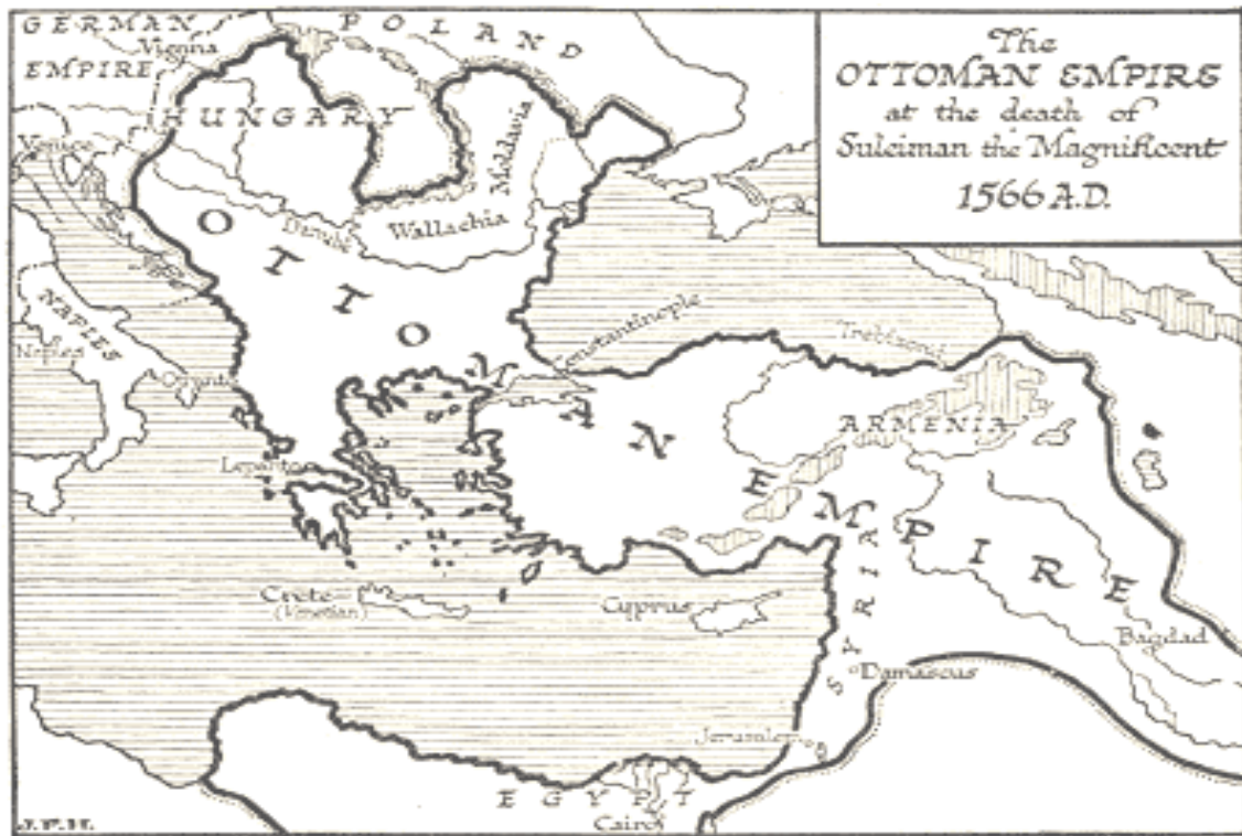
Slika 7: Osmanska država ob smrti Sulejmana II. 128

sodelovanjem vojske in mornarice, ta osmanska nevarnost pa je zblížala Ruse in Irance. Osmanski načrt ni uspel, kljub temu pa je ruski car začel s politiko pomiritve, saj se je zavedal, da jim ni kos. S Sulejmanovo smrtjo leta 1566 se je končala doba velikih osmanskih osvajanj 127 .