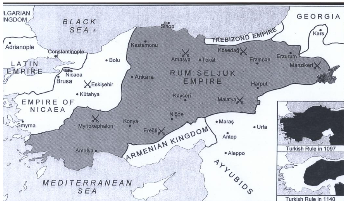
Slika 2: Država rumskih Seldžukov pred Mongolskimi osvajanji 60 .

Trajanje Rumskega seldžuškega sultanata naj bi glede na kronologije islamskih kraljestev bilo 230 let, od 1077 do 1307 oz. 1308. Natančen datum ni znan, saj je država izginila brez sledu. Na koncu je bila tako šibka, da njenega propada ni nihče opazil. Ta kronologija je zavajajoča, saj vzbuja predstavo, da je bil Rumski sultanat dolgo trajen, centraliziran imperij kot Rimski ali pa Osmanski. Pravzaprav je bil Rumski sultanat takšen samo kratka obdobja, ko so vladali močni sultani kot Kejkubad I.. Rumski sultani so trdili, da vladajo Anatoliji in včasih celo delom Sirije, v resnici pa so osebno vladali samo manjšim ozemljem. Resnična moč v delih sultanata je bila včasih v rokah lokalnih bejev ali pa v rokah napol neodvisnih guvernerjev, kot so bili številni sinovi Kilij Arslana II.. Večino svoje zgodovine je bil Rumski sultanat bolj privid imperija kot pa resnični imperij. Kljub temu pa je sultanom uspelo preprečevati anarhijo, začeli so s transformacijo nomadov v stalno naseljene prebivalce ter prenesli seldžuške tradicije družbe in vladanja v Anatolijo 59 .