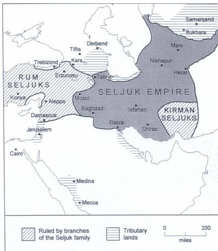
Slika 1: Seldžuška država 50 .

12. stoletju vladali na vedno manjšem ozemlju. Poleg družinskih sporov in zunanjih vojaških posegov je bil eden od razlogov za propad Seldžukov neuspeh, da bi nadzorovali nomade, ki so bili temelj njihove moči. Sultani niso mogli postati nenadomestljivi vladarji, ki bi jih nomadi podpirali zaradi česa drugega kot samo lastne koristi. Ko so se osvajanja končala, se je s tem ponavadi končala tudi lojalnost nomadov. Zadnji seldžuški sultan, Sanjar, je poskušal obnoviti seldžuško vladavino v vzhodnem Iranu, a so ga ujeli turški nomadi. Izpustili so ga 3 leta kasneje, leta 1156, leto dni pred njegovo smrtjo 49 .