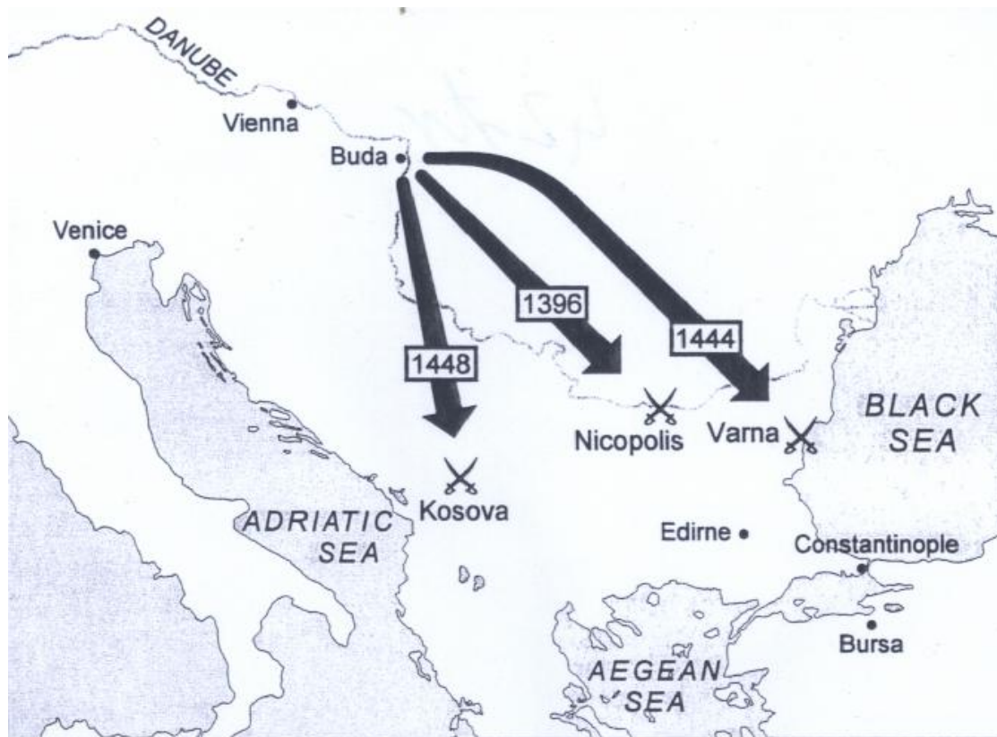
Slika 5: Križarski pohodi proti Osmanom 102 .

Murat II. je nadaljeval politiko utrjevanja osmanske moči, hkrati pa je poskušal uravnovesiti moč različnih skupin znotraj vlade. Obnovil je Bajazidov sistem suženjskih vojakov, ki jih je izuril za konjenike, pehoto in topničarje, svoje nove enote je opremil s smodniškim orožjem in iz njih ustvaril močno silo. Njegov koncept je bil ravnovesje med močno suženjsko vojsko in močno tradicionalno vojsko. Murat je bil torej miroljuben človek, ki se je bil prisiljen vojskovati. Osebno se je bolj posvečal notranjemu delovanju svoje države in dvora. Čeprav Murat države ni bistveno povečal ozemeljsko, pa je povečal osmansko oblast nad njo. Pod neposredno upravo je bilo priključenih nekaj ozemelj v Anatoliji, Bolgarija in večina celinske Grčije. Osmanski imperij je vedno bolj postajal centralizirana država, ki je na tem prostoru obstajala že za časa Bizanca. Ob Muratovi smrti je bila večina države pod popolno oblastjo sultana, osmanski pobiralci davkov, državni uradniki in sodniki so bili vsi vodeni iz osmanske prestolnice 103 .