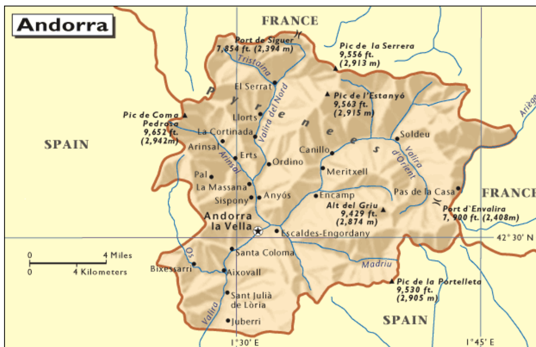
Slika 3.1: Kneževina Andora

Kneževina Andora (uradno Principat d' Andorra ) je država, ki jo prištevamo med najmanjše na svetu. Leži v vzhodnih Pirenejih med Francijo na severu in Španijo na jugu in meri 468 kvadratnih kilometrov. Osrčje Andore predstavlja dolina reke Valire, ki teče proti jugu v Španijo in je edina vrzel med gorami, ki jo obdajajo. Najvišji vrh Corna Pedrosa meri 2946 metrov (Enciklopedija svetovne geografije 1997, 60).