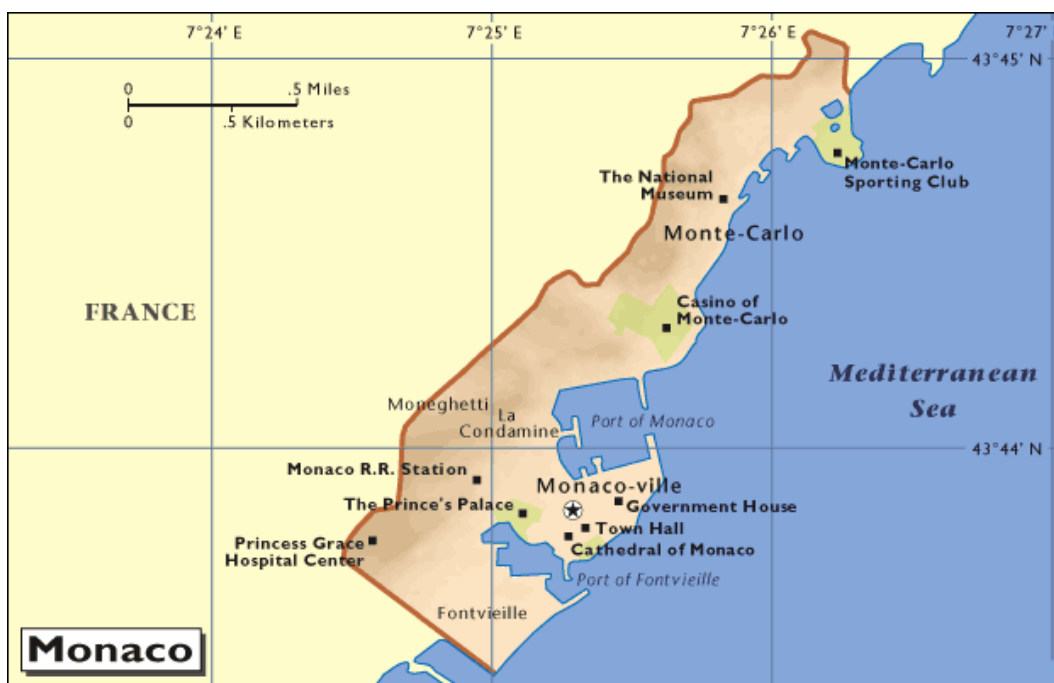
Slika 4.1: Kneževina Monako

Kneževina Monako (uradno Principauté de Monaco ) je žepna država na Azurni obali ob Sredozemskem morju in meri le 2,4 kvadratnega kilometra. Ta mali polotok s strmimi pobočji meri v dolžino 3 kilometre, v širino pa od enega do 350 metrov. Celotno ozemlje je popolnoma urbanizirano (History & Heritage 2007).