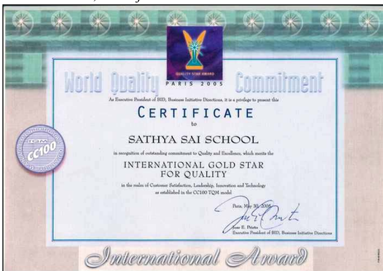
Slika 13.1.5.2.1: Spričevalo in kipec »Zlata zvezda za odličnost na področju pedagoškega dela« za Sathya Sai šolo v Ndoli, Zambija

Leta 2005 je Sathya Sai šola v Ndoli prejela mednarodno priznanje, Zlata zvezda za odličnost na področju pedagoškega dela, vodenja, inovacije in poučevanja. Priznanje vsako leto podeljuje svetovno priznana špansko podjetje BID (Business Initiative Directions), ki se ukvarja s svetovanjem in izboljševanjem poslovnih odnosov na različnih področjih.