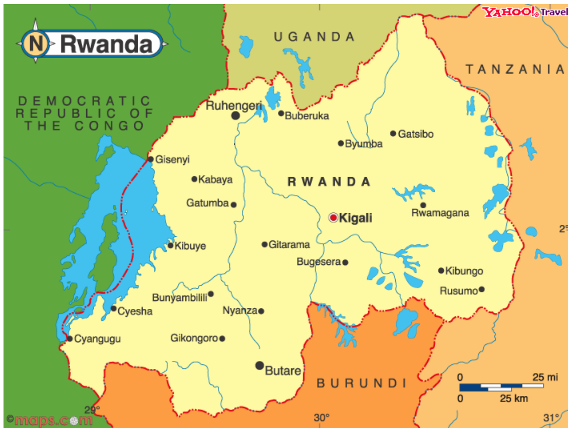
Slika 5.5.1: Zemljevid Ruande