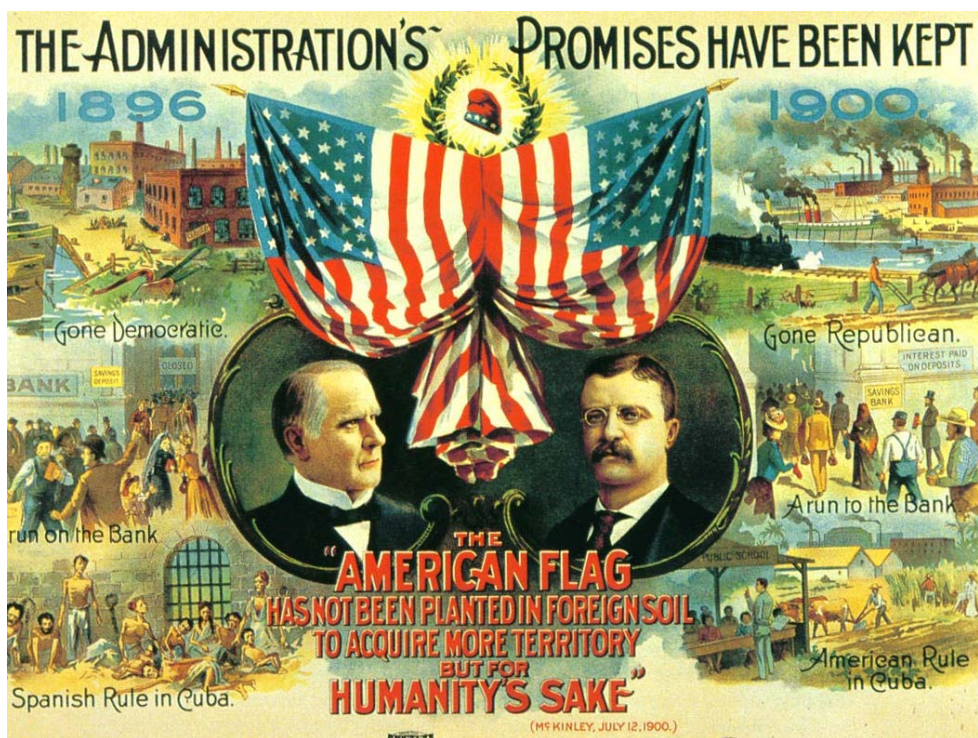
Slika 3.3.3.1: Primer plakata republikancev

Poleg ekonomskih in verskih motivov so imeli ključno vlogo tudi strateški motivi evropskih držav. Kot tipičen primer strateške kolonizacije je Rt dobrega upanja, ki je ščitil južno pomorsko-trgovsko pot med Evropo in Azijo. Številna kolonialna osvajanja so bila usmerjena v ščitenje investicij evropskih držav (kot je primer okupacije Egipta s strani britanskega otočja). Britanija je svoje razloge opravičevala tudi s t.i. humanitarnimi motivi (glej sliko 3.3.3.1) kot je izpodrinjanje suženjstva, kar je bil glavni argument za kolonizacijo določenih predelov Afrike (Cell 2007: 3).