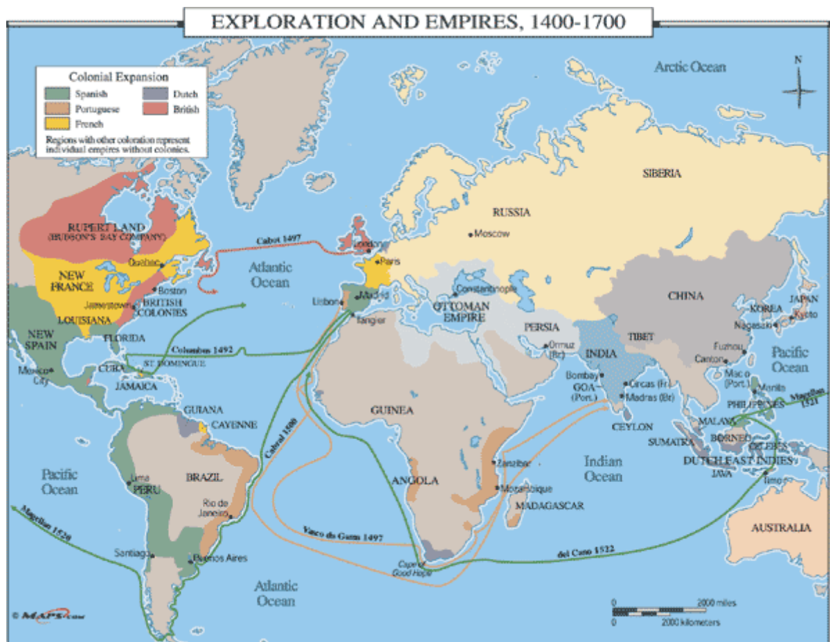
Slika 3.4.2.1: Doba geografskih odkritij in evropska ekspanzija med leti 1400-1700

znane kot kapitulacije. 7 Te so dovoljevale prosto trgovanje evropskih držav na ozemlju Otomanskega imperija pod enakimi pogoji kot so veljali za domače trgovce. Še več, kapitulacije so evropske metropole izrabljale kot orožje manipulacije poseganja in omejevanja suverenosti imperija, česar pa se Otomani niso najbolj zavedali. Evropske države so si tako znatno povečale trgovske privilegije, hkrati pa so bili turški prebivalci, ki so prišli pod okrilje države podpisnice, pravno odgovorni le tej državi in ne več zakonom Otomanskega imperija (The Ottomans.org 2002b–e).