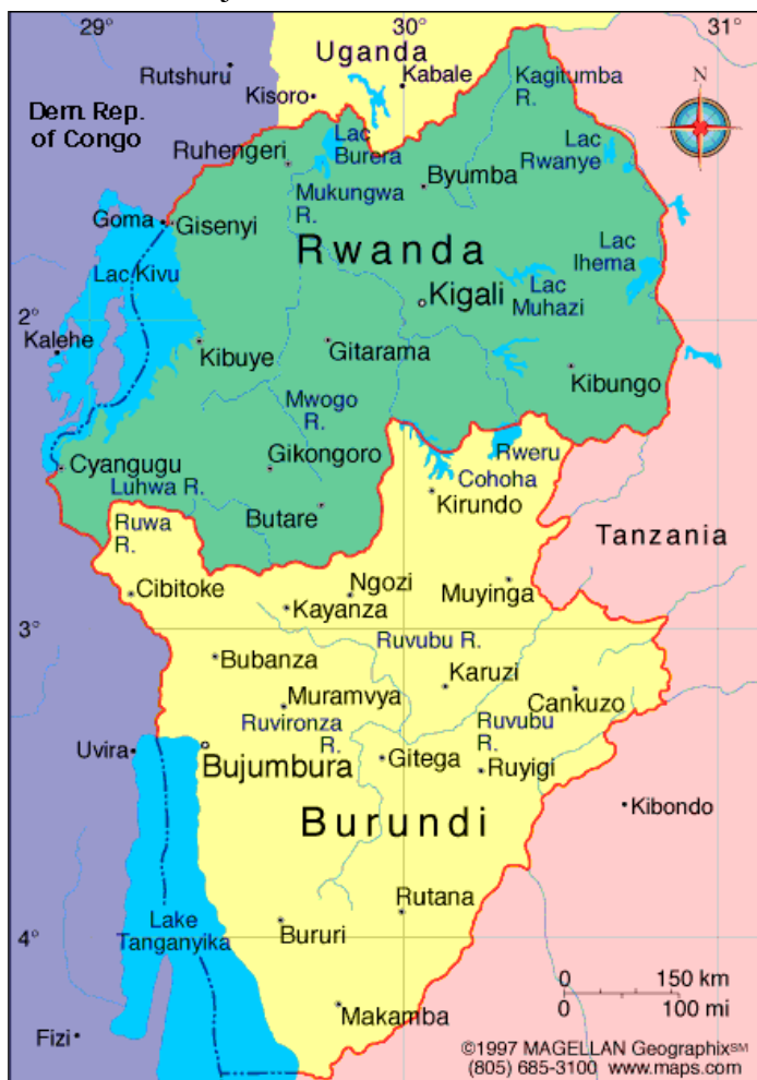
Slika 6.1: Zemljevid Ruande 40

Ruanda leži na vzhodu afriške celine ob Viktorijinem jezeru. Sosednje države so na zahodu Demokratična republika Kongo (prej Zaire), na vzhodu Kenija, na severu Uganda ter Tanzanja in Burundi na jugu. Uradni naziv Ruande je republika Ruanda, po ustavi, ki jo je sprejel začasni parlament je predsedniška republika. Število prebivalcev je približno 8 milijonov, površina ozemlja pa 26.338 kvadratnih metrov. Je izredno hribovita dežela, gorovja jo obdajajo iz vseh strani. Razdeljena je na enajst provinc, ki se delijo na občine, te pa vodijo župani oz. tako imenovani bourgmestres, ki jih izvoli predsednik Ruande. Zaradi reliefne razgibanosti in njene drugačnosti, specifičnosti, Ruando pogosto imenujejo tudi Tibet Afrike (Gerbec 2007: 34).