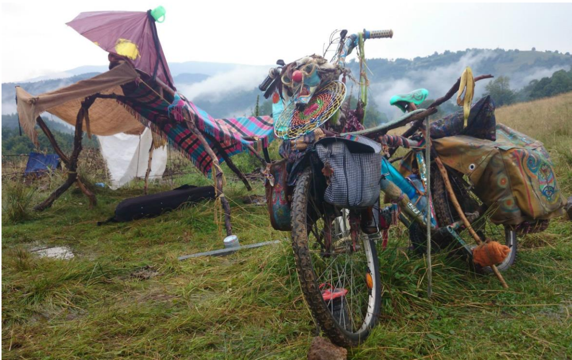
Vir: Tjaša Zidarič (2014).