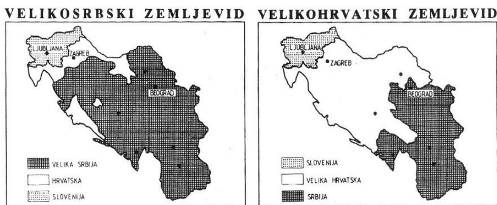
Slika 6.1: Zemljevid Velike Srbije in Velike Hrvaške.

prebivalstvo je bilo glede na popis iz leta 1991 sestavljeno iz 44 % Muslimanov, 31 % Srbov in 17 % Hrvatov. (Judt 2007,762; Repe 2008, 31. julij) Ker sta tako Beograd kot Zagreb ob razpadu skupne države želela uresničiti svoje nacionalistične ideje o združitvi vseh Srbov (Velika Srbija) (glej sliko 6.1) oziroma vseh Hrvatov v eni državi (Velika Hrvaška) (glej sliko 6.1), so se njuni interesi križali na narodnostno mešanih območjih (kot sta Krajina in Slavonija), politično motivirani boji so zato najprej izbruhnili na teh območjih in se nato razširili na širše območje. (Radaković 2003, 176; King 2009)