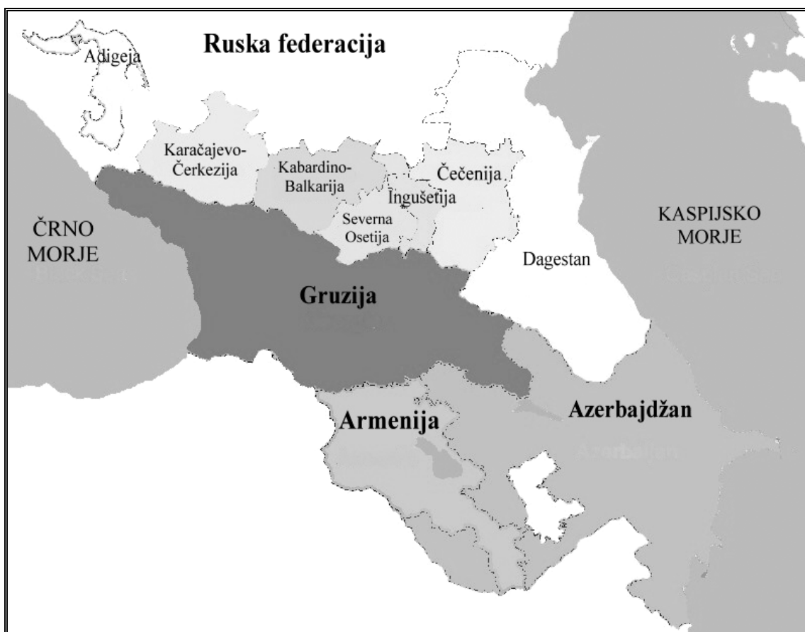
Slika 3: Zemljevid Severnega Kavkaza