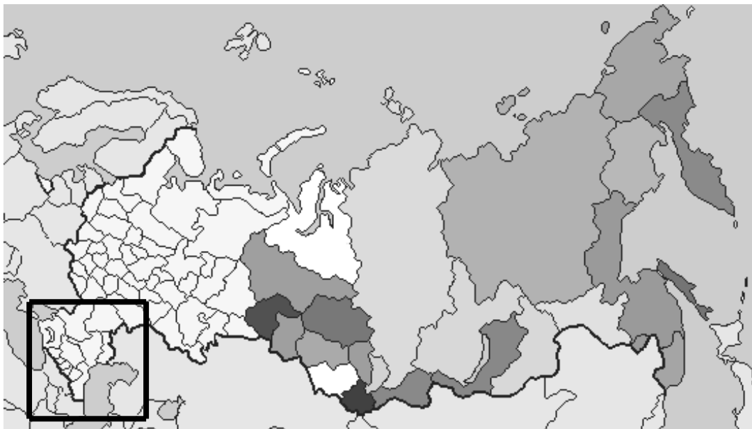
Slika 1: Zemljevid Ruske federacije (vseh 89 subjektov) 18