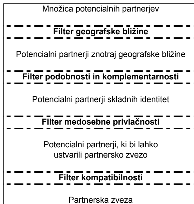
Slika 1: Model filtriranja partnerjev