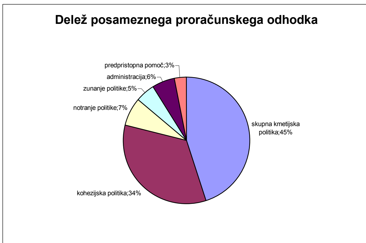
Graf 1: Delež posameznega proračunskega odhodka v proračunu za leto 2003

O pomenu, ki ga EU posveča usklajenemu regionalnemu razvoju, govori podatek, da je za programe strukturnih in kohezijskih skladov namenjenih kar 35% proračuna EU (Kezunovič, 2003: 96).