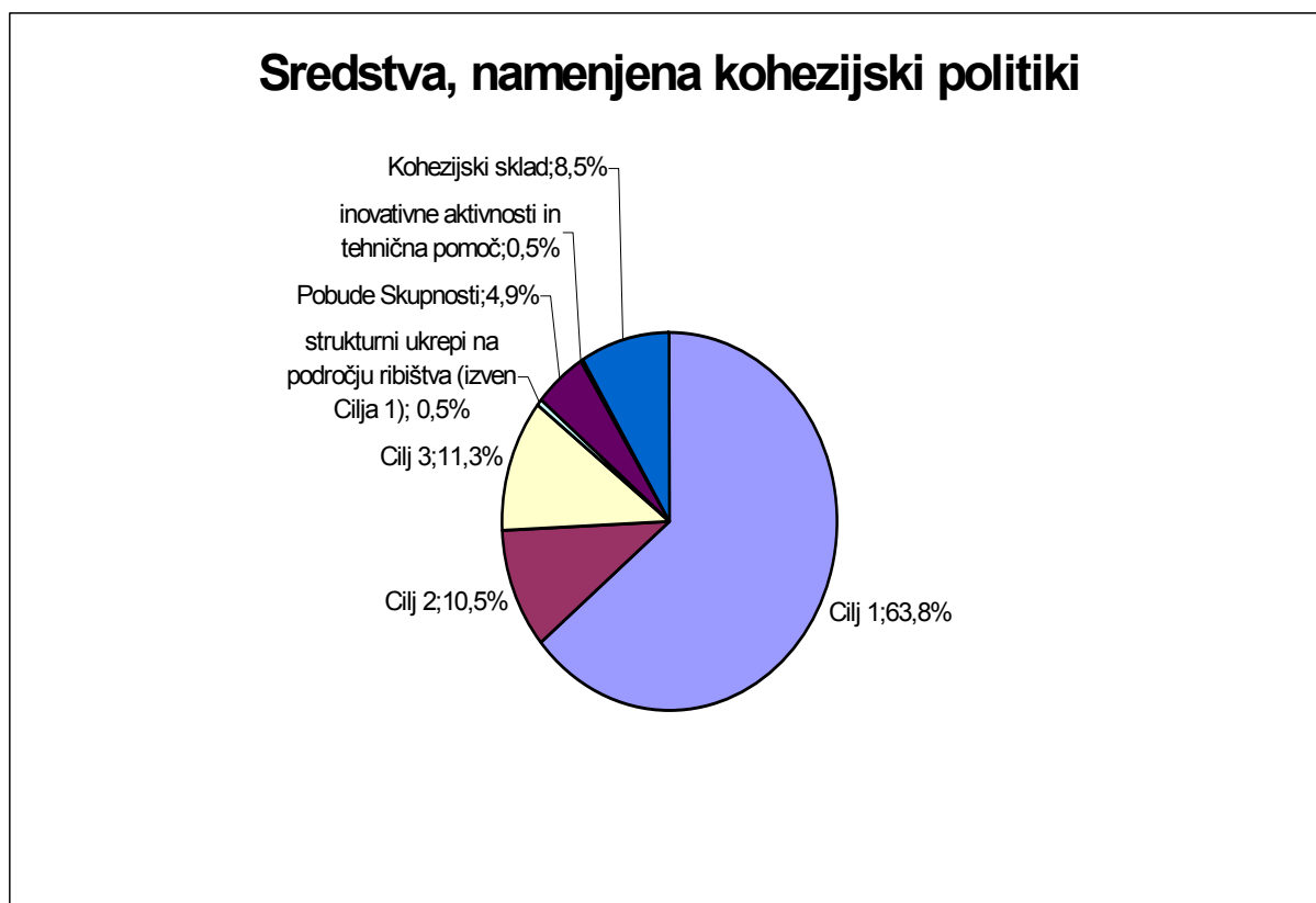
Graf 2: Razdelitev proračunskih sredstev, namenjenih za kohezijsko politiko v obdobju 2000–2006 (v milijonih evrov in cenah 1999)