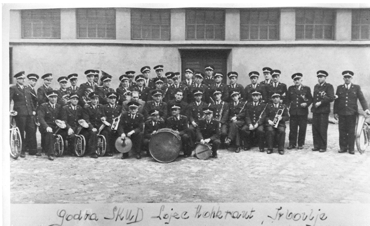
Slika 4.2: Delavska godba Trbovlje leta 1949

največ pa v Cementarni, Strojni tovarni Trbovlje, Rudisu, precej je študentov ...» (Krajšek v Anderle, 1982)