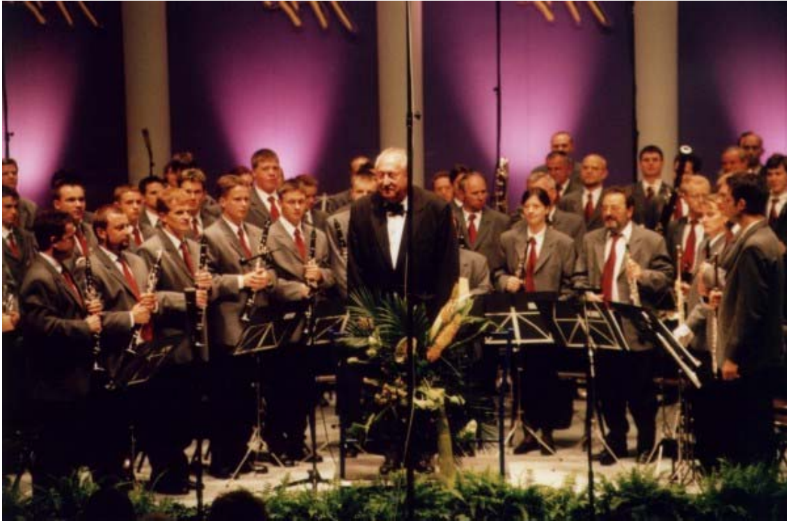
Slika 5.6: Nastop na 14. svetovnem prvenstvu pihalnih orkestrrov v Kerkradeju na Nizozemskem , 21. julija 2004

Za svoje dosežke je Delavska godba Trbovlje prejela priznanja tako na občinski kot tudi državni ravni: