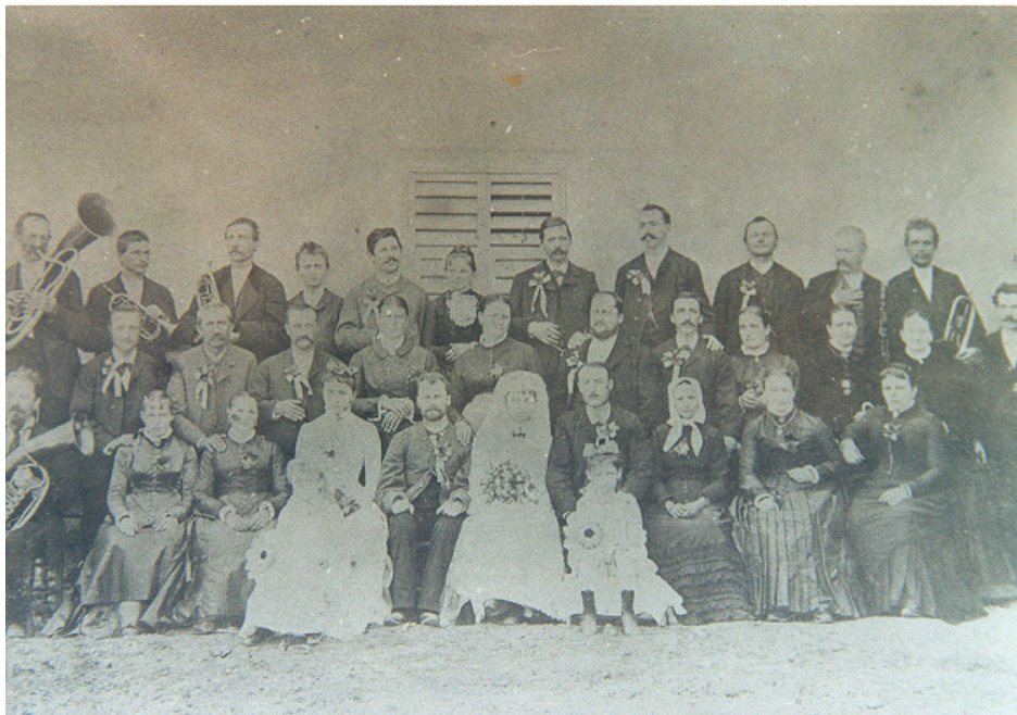
Slika 5.3: Poroka na dvorišču pri Dimnik, leta 1886

Godbo so ljudje takoj sprejeli. Edina pred godbo znana glasba je prihajala iz cerkve ali od priložnostno zapetih ljudskih pesmi, včasih tudi od godcev. Priljubljena je bila tudi zaradi svojih vzpodbudnih zvokov pihal, trobil, tolkal, iz katerih so odmevale koračnice, polke in valčki. Igrali so lahko na prostem in med gibanjem. Brez godbe si ni bilo mogoče predstavljati nobenega pomembnejšega dogodka. (Kalšek, 2001: 53)