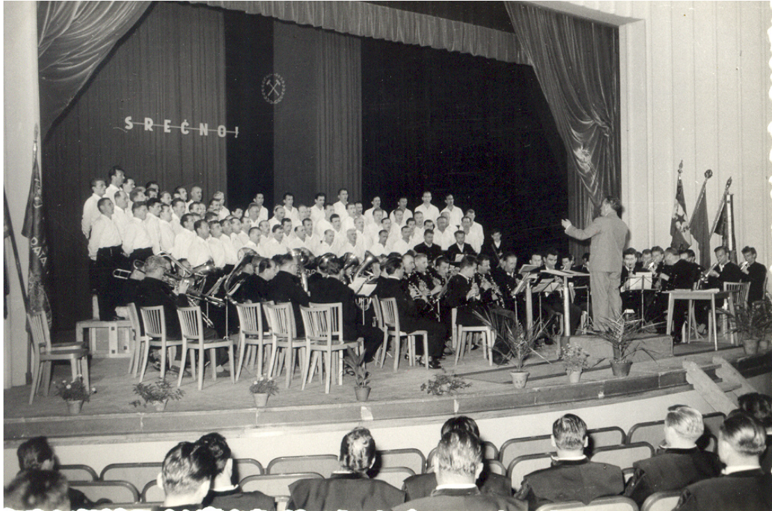
Slika 5.4: Proslava dneva rudarjev v Trbovljah, 1.8.1967. Nastop Delavske godbe Trbovlje in pevcev iz Trbovelj in Hrastnika.

Izvajali so tudi že zahtevnejše skladbe, ki so bile velik zalogaj tako za godbo kot tudi za poslušalce, ki so si marsikdaj želeli slišati lahka, ušesom prijazna in nezahtevna dela. Pričakovanja ob nastopih godbe so bila različna. Tako Zasavski udarnik iz leta 1949 komentira nastop godbe takole: »Program je bil razdeljen na dva dela, ki sta vsebovala po nekaj klasičnih in deloma partizanskih, deloma novejših del [...]. V splošnem bi lahko omenil, da bi mogla godba s svojo zmogljivostjo predvajati dela, ki niso tako utrujajoča za poslušalce, kjer bi morali slediti koncentrirano predvajanju, odnesti pa vtis, da godba ni želela nuditi poslušalcem dela, ki naj bi jih v njihovem težkem dnevu razvedrila.« (v Zasavski udarnik, 1949: 4)