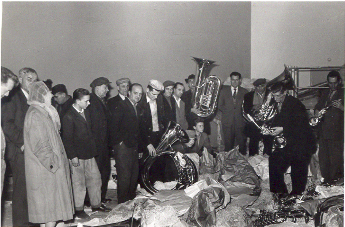
Slika 6.7: Novi inštrumenti so pomenili nov zagon, december 1956