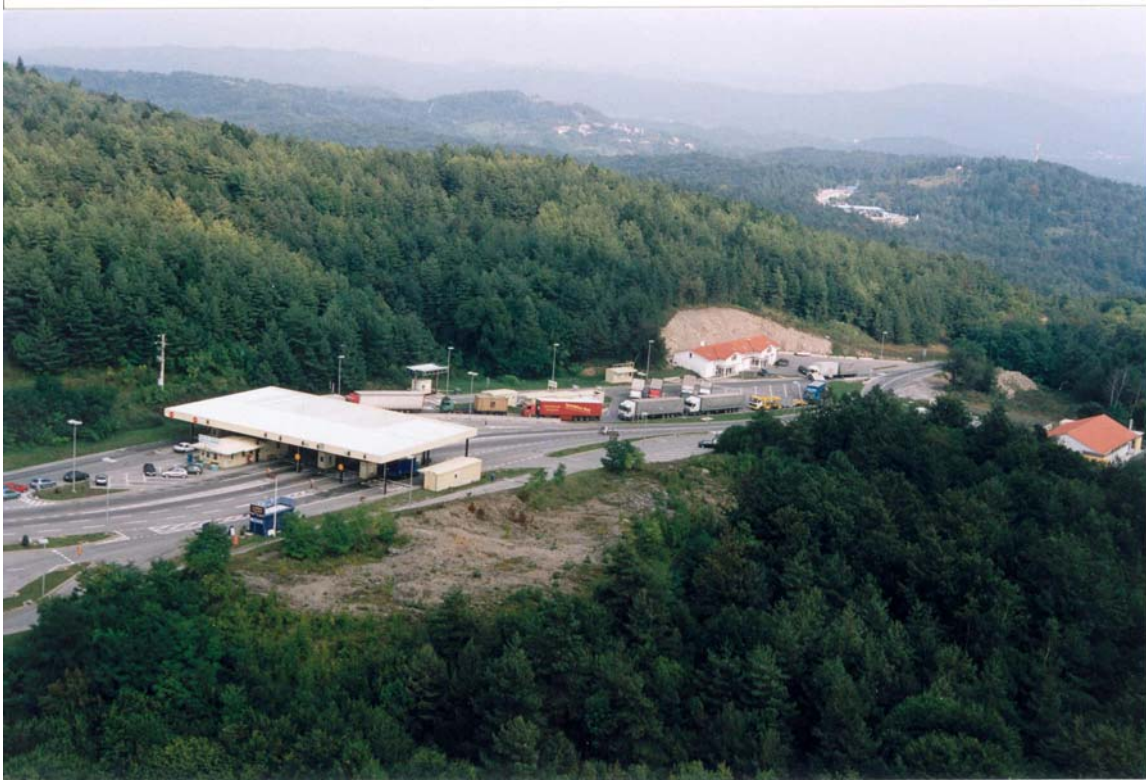
Mejni prehod Starod (Pasjak): slovenski mejni prehod je od hrvaškega (v ozadju desno) zaradi konfiguracije terena oddaljen 1200 metrov

Mejna prehoda pomenita neposredno fizično oviro za krajanje Jelšan in Staroda, v zadnjih letih pa tudi za ljudi živeče v drugih vaseh ob obeh prometnicah, ki peljeta na mejni točki.