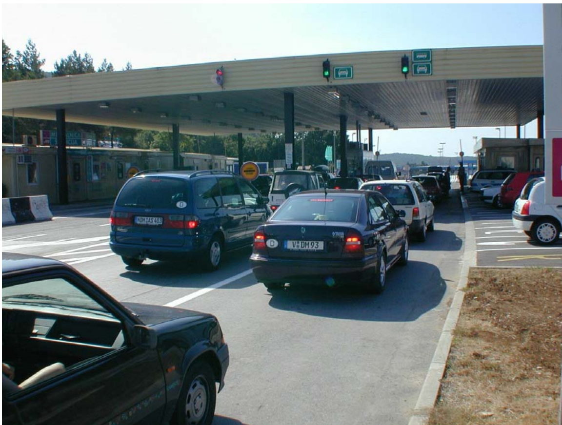
Mejni prehod Jelšane sredi turistične sezone

Najmanj zadnja štiri leta, v katerih je po nekajletnem premoru spet narasel turistični obisk na hrvaški obali, je npr. kolona čakajočih vozil na prestop meje v Jelšanah na vrhuncu turistične sezone segala celo v mesto Ilirska Bistrica (oddaljena 11 kilometrov od mejnega prehoda Jelšane). Jelšancem, ki želijo tedaj v občinsko središče, preostane le cesta (do lani makadamska) prek Novokračin in Sušaka in nato skozi gozd in skozi Podgoro (Zabiče) do Ilirske Bistrice. Med vikendi, zlasti tistimi, ko se menjavajo gostje v hrvaških turističnih krajih, pa tudi ob večjih praznikih, npr. veliki noči, policisti beležijo več kot triurne čakalne dobe za prehod meje. Poleg velikega turističnega navala sta razloga za gnečo tudi neurejena infrastruktura in zmogljivost mejnih prehodov ter slaba pretočnost cestnih povezav med državama. Tudi v primeru prometnih nezgod ni ustreznih obvoznih cest, tako da prihaja do velikih zastojev. Ko pa se cesta npr. ponovno odpre, vsa vozila naenkrat pridejo na mejne prehode. Policisti ugotavljajo, da so te razmere na Hrvaškem še slabše kot v Sloveniji.