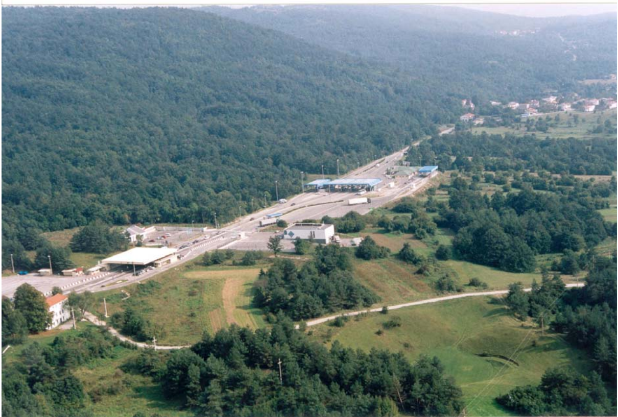
Mejni prehod Jelšane, v ozadju desno vas Rupa (Hrvaška)

Iste dne je jugoslovanski zvršni svet aktiviral odloka o zavarovanju meja ter o prisilni izterjavi carine, hkrati pa v Slovenijo poslal carinike iz drugih delov Jugoslavije. Hkrati je zvezna vlada sprejela še sklep o zamenjavi devetih upravnikov carin v Sloveniji, ki so prestopili v slovensko službo. Prav »ti ukrepi so bili neposreden uvod v spopad, na katerega pa je bila tedaj Slovenija že bistveno bolj pripravljena.« (Repe, 2002:275)