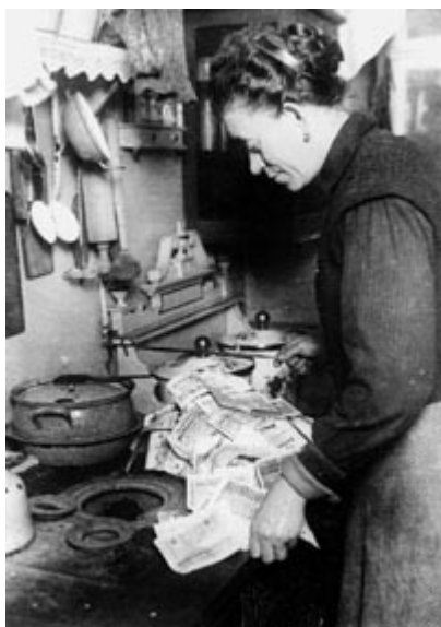
Nemška žena neti ogenj z več milijoni nemških mark;

Zlom newyorške borze oktobra 1929 manifestira nastajajočo svetovno gospodarsko krizo, ki je zadevala od Združenih držav odvisno politiko nemškega kapitala in je vodila v propad weimarske republike.