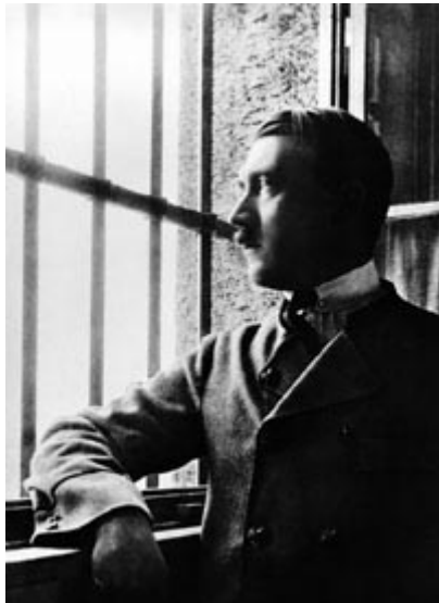
Adolf Hitler v priporu čaka na sojenje (1924);

Vlada je odgovorila z razglasitvijo pasivnega upora "Ruhrkampf", ki je s finančne strani pomenil katastrofo; trajal je do jeseni 1923. Hiperinflacija, ki je močno pretresla socialni položaj in povzročila državljansko krizo, se je uspela zaježiti skozi denarno reformo 15. 11. (Schulze, 1982). Renski separatizem, ki svoj vrhunec doseže z razglasitvijo Renske republike 21. 10., ni dosegel svojega cilja. Že nekaj časa svojeglava bavarska politika, ki je ogrožala celovitost rajha, stopi še stopnico višje 9. 11. s Hitlerjevim pučem, ki se usmeri tako zoper bavarsko vlado kot tudi Berlin. Kljub negotovosti predvsem bavarskega dela rajhsvera upor ni uspel in je bil hitro zadušen (Boockmann, 1984).