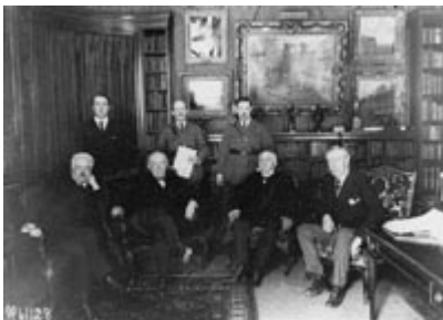
Skupinska slika udeležencev mirovne konference v Versaju; 1. v vrsti od desne: Woodrow Wilson (USA), George Clemenceau (Francija), David Lloyd George (Anglija);

Prednostno nalogo, to je finančno reformo, ki bi omogočila