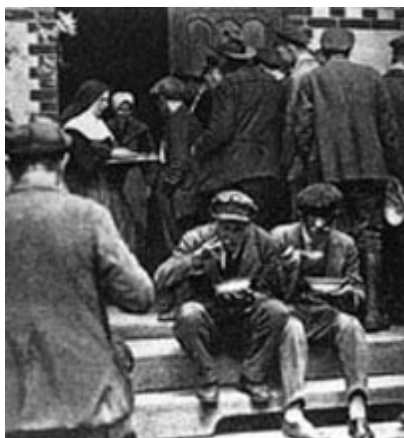
Prenatrpane spalnice v berlinskem azilu za brezdomce "Palme"; © Bertelsmann Lexikon, založba Gütersloh

Z vedno večjo gospodarsko krizo, zlomom nemških bank in masovno brezposelnostjo se Brüning spopade z deflacijskimi ukrepi in s tem zaostri socialno in politično ozračje. Krčenje strank v času obeh državnozbornih volitev 1932 je dalo upanje izhodu iz krize samo še v obliki državne ureditve, ki bi pomenila odmik od Weimarja (Möller, 1983).