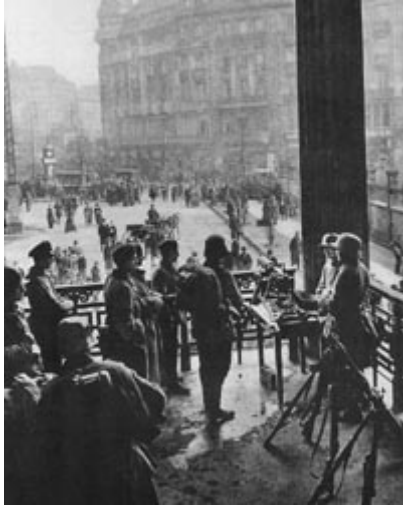
Zasedba železniške postaje v Berlinu; © Bertelsmann Lexikon, založba Gütersloh

Volitve v nacionalni zbor 19. 1. 1919 so prinesle za SPD 165, Center 91 in DDP 77 mandatnih mest. Te tri stranke weimarske koalicije so tako imele večino. Opozicijo tvorijo poslanci USPD z 22, desničarji DNVP s 44, DVP z 19 in ostali s 7 mandatnimi glasovi. Ebert 11. 2. dobi predsedniški mandat, stranke weimarske koalicije pa tvorijo vlado pod P. Scheidemannom (SPD) (Benz, 1988). Najtežja naloga, s katero se je morala soočiti