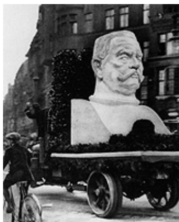
Na dan volitev so po ulicah vozili doprsni Hindenburgov kip;