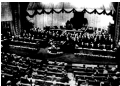
Friedrich Ebert, sredi govora pred nacionalnim zborom, teater Weimar (3.03.1919)