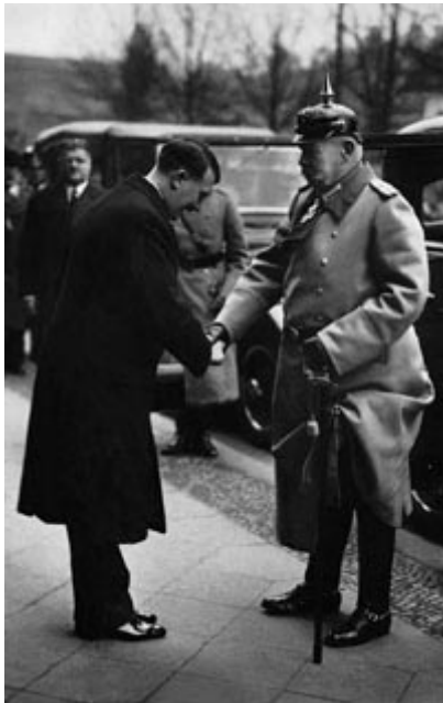
Adolf Hitler pozdravlja predsednika Paula von Hindenburga

Glede na ohromljeno stanje parlamentarnega sistema so najpomembnejše interesne skupine videli rešitev pred izbruhom državljanske vojne samo še v direktnem sodelovanju Hitlerja na oblasti.