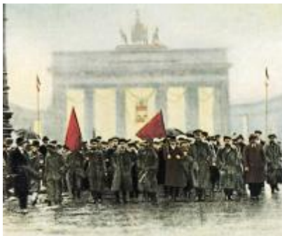
Revolucionarne čete in delavstvo podpirajo radikalno pozicijo Spartakove zveze skupaj s Karlom Liebknechtom in Roso Luxemburg (Berlin, november 1918)