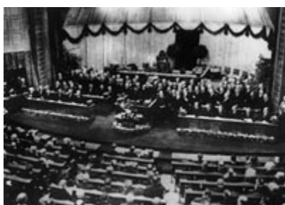
Zasedanje nacionalnega zbora; Weimar (1919); Corbis - Bettmann, New York

Demokratska ureditev Nemčije med leti 1918 - 1933 je dobila ime po kraju zasedanja nacionalnega zbora med 6. 2. in 30. 9. 1919. Čeprav stopi ustava v veljavo šele 11. 8. 1919 in formalno traja do leta 1945, velja trajanje weimarske republike od njenega izglasovanja 9. 11. 1918 do 30. 1. 1933, ko Hindenburg preda Hitlerju mesto kanclerja (Benz, 1988).