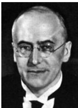
Rajhkancler Heinrich Brüning;

Brüning se je odslej pretežno opiral na izredni zakon predsednika in grožnjo o razpustitvi parlamenta. S tem se je