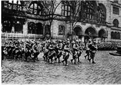
Francoske čete korakajo v Duisburg in prevzemajo mestno kontrolo (Marec 1923).