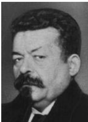
Bodoči predsednik Friedrich Ebert

V času zloma nemške vojaške sile so se v začetku novembra 1918 po celotni Nemčiji začeli tvoriti t. i. delavski in vojaški uradi, katerih primarna naloga je bila spoprijeti se s problemom, ki ga je prinesel konec vojne, predvsem socialni problem. V decembru istega leta pa so ti že začeli stremeti po politični moči. Predstavniki SPD in USPD so v novembrski revoluciji pod vodstvom F. Eberta prevzeli breme, ki ga je za seboj pustila vojna.