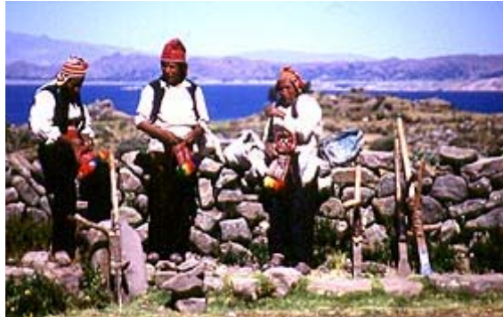
Slika 4.5: odmor s kokinimi listi.

se nenehno gibljejo, kokain iz listov pa otopeva njihove čute in odstranjuje mnoge skrbi. Njihovo vedenje izraža ravnodušnost. (Riviere, Peter (1979): »Ljudstva sveta II«.Mladinska knjiga, Ljubljana, str.258)