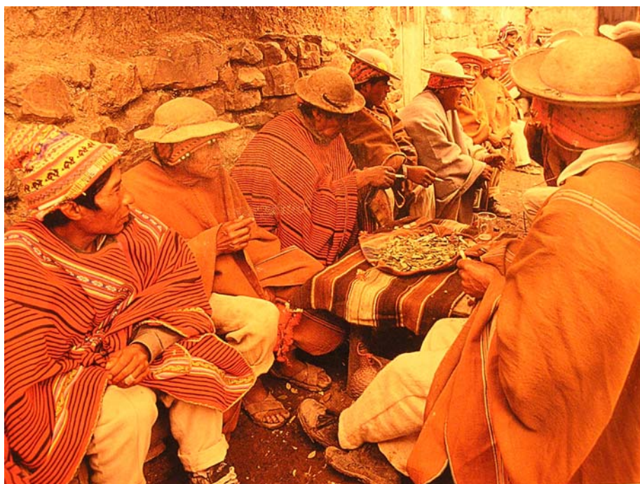
Slika 6.1:.

kulturne zaostalosti se zavarovali pred mrazom. Ima tudi pomembno vlogo v domači medicini. Kokin list je najboljši prijatelj Indijanca, naj bo rudar ali delavec, od rojstva pa do smrti (glej sliko 6.1.). V primeru fizične ali duševne utrujenosti, brezupu in trpljenju, majhni zeleni listi pomagajo v stiski (lakota, žalost, trpljenje) in kot čudežen eliksir življenja dajejo življenjsko moč delavcem pri opravljanju mukotrpnega dela na suhi, nerodovitni zemlji ali v rudniku.