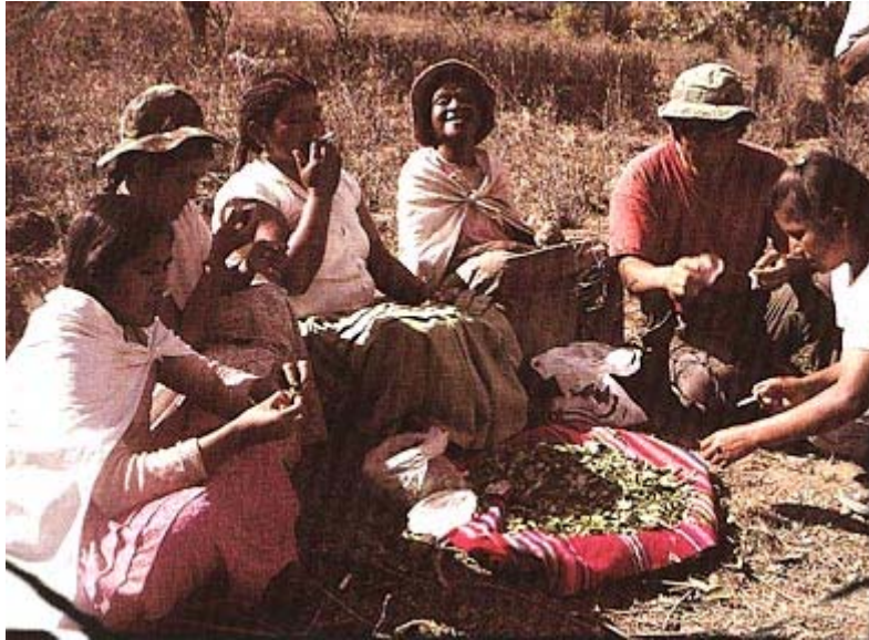
Slika 5.1: domačini iz Yungasa.

Etimološko beseda coca izhaja iz Ajmara jezika in pomeni obrok, hrano za popotnike in delavce. Pred vsakim začetkom dela moški žvečijo koko in prosijo goro, da se jim delo obrestuje. Pri hišnih opravilih ali domačih slovesnostih, kjer prisostvujejo tudi ostali vaščani, lastnik hiše zagotovi zadostno količino koke. Koka da ljudem moč, ko slavijo zaključek dela ali pri žalovanju skozi noč. Koka stimulira centralni živčni sistem in povzroči nespečnost, spočitost in prežene utrujenost. Pri teh dogodkih se ženske in moški zberejo ločeno, lastnik hiše pogosti goste, nato žvečijo koko in pijejo blažje alkoholne pijače. Večer in noč potekata tako, da si pripovedujejo šale in zgodbe ter se tako zabavajo. Zaradi vsega tega osrečijo Goro in jo pomirijo.