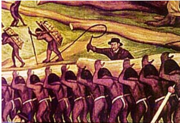
Slika 4.6: trpljenje sužnjev.