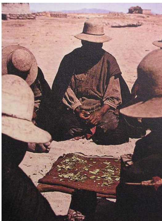
Slika 5.4: vrač.

Mnogi avtorji, med njimi tudi Constable, so prepričani, da je bila koka prisotna v vseh magičnih in ritualnih ceremonijah. Kokine liste so vrgli v zrak ali na tekočino in nato iz položaja padlih listov razbrali prihodnost. (Constable, 2002: 81) Napovedovanje iz kokinih listov poteka tako, da so ti razdeljeni na štiri dele; svet »nad«, svet »pod«, preteklost in prihodnost. Yatiri dvigne tri liste v zrak in jih obrne na vse štiri strani neba. To se imenuje Kintu in predstavlja prošnjo. Z opazovanjem oblike listov lahko Yatiri vedežuje ljudem o vsem, kar jih zanima: preteklost, sedanost, zdravje, itd. (Hurtado, 2002: 22) Na območju Andov, vrač oz. yatiri , ki je zelo spoštovana osebnost, prerokuje prihodnost iz tega, kako padejo kokini listi. Prerokba se največkrat nanaša na vprašanje, kakšna bo letina, zdravje ljudi ali posebna osebna vprašanja.