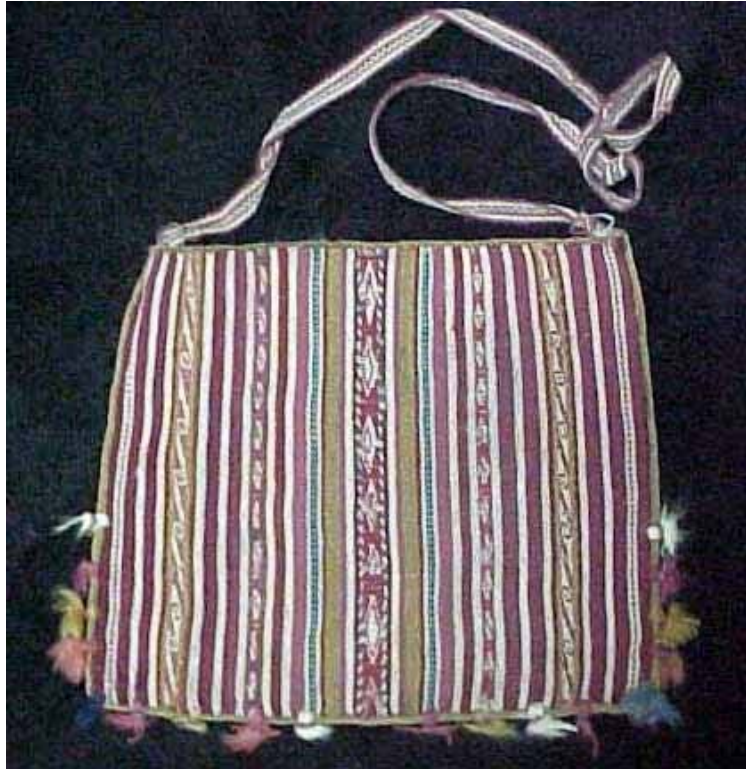
Slika 6.3: (vir: Thorpe, BBC).

Koka je grm, ki zraste do velikosti človeka. Nabrane liste posušijo na soncu ter jim primešajo trohico lypte, nato pa jih v tej obliki žvečijo, podobno kot na vzhodu betelove liste. S pičlo zalogo koke v malhi in s peščico praženih koruznih zrn opravljata sodobni peruanski Indijanec dan za dnem svoja naporna potovanja, ne da bi se utrudil ali vsaj, ne da bi se pritoževal. Celo najkrepčilnejša hrana mu manj zaleže kot mamilo, ki mu je tako pri srcu. Pod Inki je bila koka baje namenjena izključno višjim slojem. (Prescott, H. William (1957): »Osvojitvev Peruja«. Cankarjeva založba, Ljubljana, 1957, str. 86)