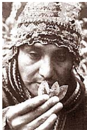
Slika 5.5