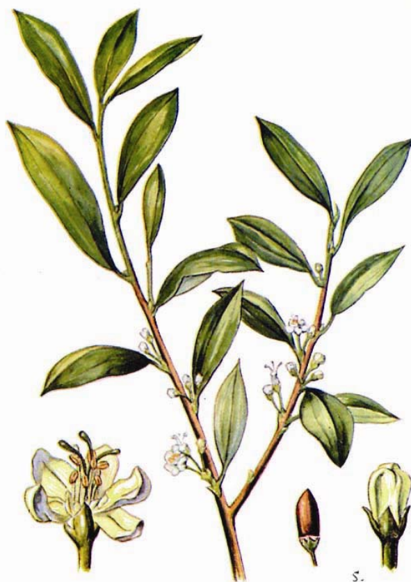
PLATE XX.— Erythroxylum coca (Coca). (From Jackson: Experimental Pharmacology and Materia Medica. )

znanstvenikom plačali 150 milijonov dolarjev za gensko spremenjeno koko, le-ta bi imela 100% večjo vsebnost alkaloida.