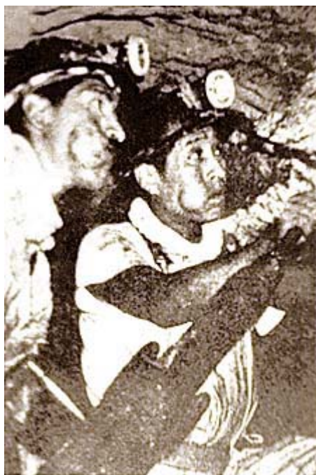
Slika 6.2: rudarja.

Rudar je pred vstopom v rudnik za svojo varnost in uspeh pri delu andskemu božanstvu Tio (zaščitnik rudarjev) daroval kokine liste. »Še enkrat si napolnim usta s koko in s Tiovo pomočjo bom kmalu končal. Hvala bogu, da imam koko, drugače ne bi mogel preživeti. Vsak dan me stane več!« (Hurtado, 1995: 34)