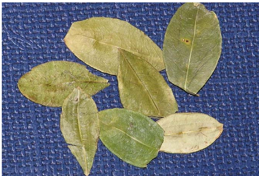
Slika 4.2: kokini listi.