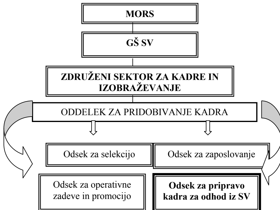
Skica 6.3: Organizacijska umestitev Odseka za pripravo kadra za odhod iz sistema