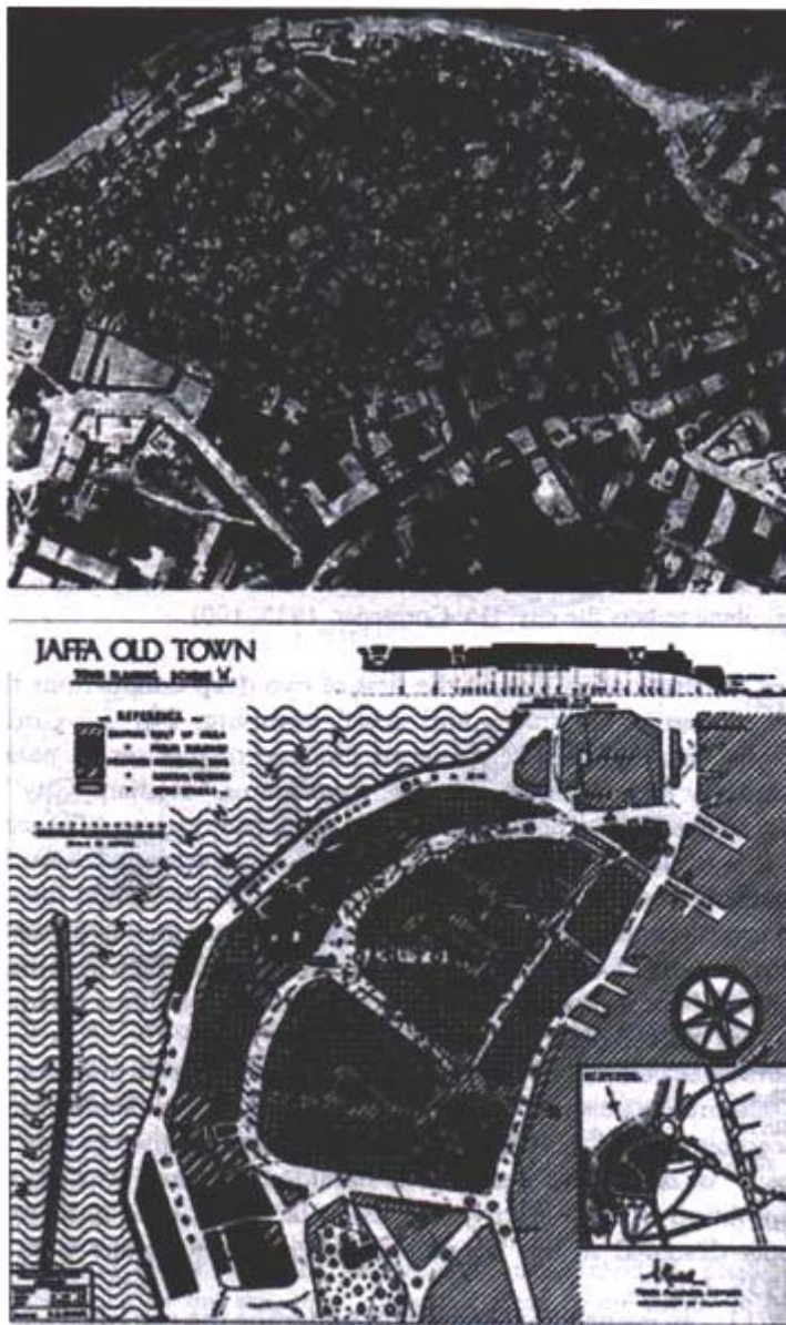
Slika 4.1: Operacija Sidro

Tako kot kaže slika 4.1. je bil palestinski Casbah v Jaffi na podoben način z eksplozivi preoblikovan v, kot so temu rekli Britanci, Operacija Sidro. S to operacijo so si Britanci želeli zagotoviti večjo varnost pred palestinskimi ostrostrelci s streh bližnjih stavb v starem centru mesta. Naredili so bulvarje v obliki sidra ter nevarnost ostrostrelcev občutno zmanjšali. Takšni vojaški diskurzi, ki z oblikovanjem mest povečujejo nadzor, so jedro strateških diskurzov tudi v dandanašnjih post cold war časih (Graham).