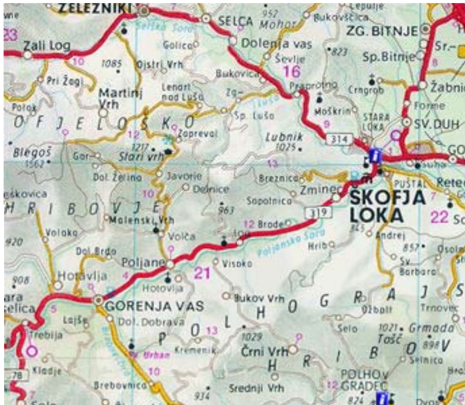
Slika 2: Preglednejša karta območja Poljanske doline

Vir: http://www.creativ.si/wts/engine/roadmap.exe?map=207&lang=0&cp=0