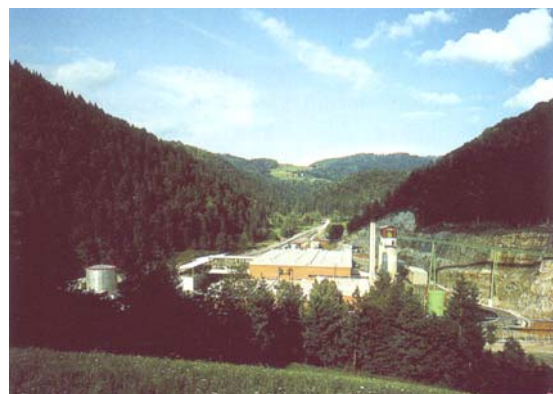
Slika 9: Isti pogled čez deset let, poleti 1988 - RUŽV