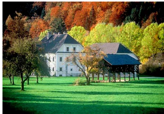
Slika 11: Tavčarjev dvorec danes