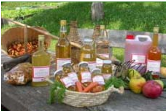
Slika 4: Domači izdelki kmetije Matic iz Hotavelj

Domačini Poljanske doline se v okviru domače obrti najraje ukvarjajo z izdelavo domačega sira iz kravjega in kozjega mleka, peko piškotov in drugega peciva (kmetija Pr'Čum iz Studorja, kmetija Pr'Režen iz Poljan), izdelavo domačih sokov in žganih pijač, sušenjem sadja (kmetija Pr'Matic na Hotavljah, Naconova kmetija v Vinharjah), pridelava medu (kmetija Pri Jakuc iz Poljan), zelo cenjena in tipična za Poljansko dolino pa je tudi izdelava čipk (idrijska in žirovska čipka). V Žireh so prav letos pripravili veliko slavje, t.i. Klekljarski dan (Rant 2006: 1), v okviru stoletnice neprekinjenega delovanja čipkarske šole. Klekljanje je močno zaznamovalo življenje družin v teh krajih, saj so v preteklosti mnogim pomenile tudi vir preživetja. Čipki, tako stari kot tudi mladi, ostajajo zvesti še danes, pa čeprav iz popolnoma drugačnih nagibov.