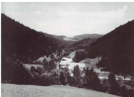
Slika 8: Todraž s strani Žirovskega vrha, poleti 1978

Za majhno ruralno Gorenjo vas in nasploh Poljansko dolino je ustanovitev Rudnika urana Žirovski vrh pomenilo velike spremembe, in sicer tako v smislu industrijske razvitosti in razpoznavnosti kot tudi na socialnem, kulturnem, prostorskem in okoljskem področju. Nahajališče urana na Žirovskem vrhu je bilo odkrito v maju leta 1960, rudnik urana Žirovski vrh pa so na prostoru dveh podrhtih domačij ustanovili leta 1976 (Florjančič 2000).