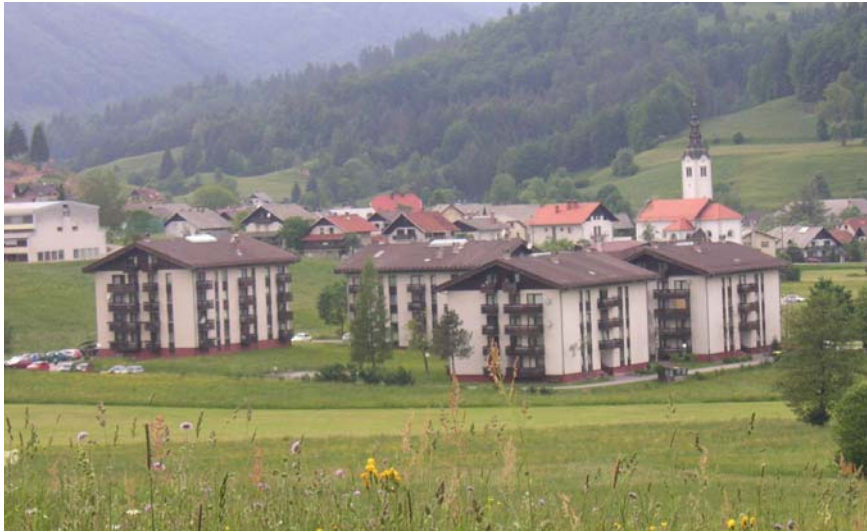
Slika 6: Štirje bloki v Blatih, ki so bili zgrajeni predvsem z namenom, da bi se preprečil stanovanjski problem delovne sile rudnika urana Žirovski vrh. Bloki stojijo na močvirnatem zemljišču na robu Gorenje vasi.