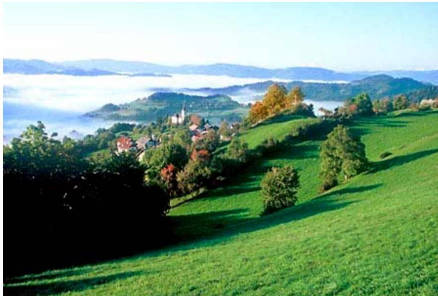
Slika 3: Razgibana pokrajina Poljanske doline

Kar 71% vseh površin predstavlja gozd, kmetijska zemljišča pa predstavljajo 27% celotne površine območja (Območni razvojni program 2002-2006). Glavna gospodarska dejavnost je kmetijstvo, ki se zaradi sodobnih gospodarskih razmer vedno bolj intenzivno dopolnjuje z raznovrstnimi dopolnilnimi dejavnostmi.