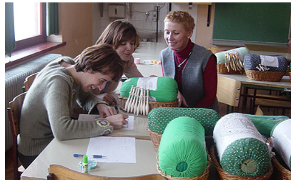
Slika 5: Izdelava čipk- čipkarska šola Žiri