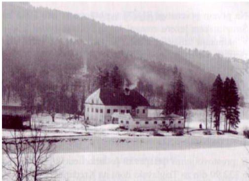
Slika 10: Tavčarjev dvorec pred prenovitvijo, pred letom 1985 Vir: Florjančič, P. (2000): Rudnik urana Žirovski vrh

Rudnik urana Žirovski vrh je veliko prispeval tudi na kulturnem področju. Leta 1983 je v svojem stanovanjskem bloku na Blatih dal Knjižnici Ivana Tavčarja Škofja Loka na razpolago izposojališče v vrednosti takratnih 2,4 milijona din. Poleg tega je leta 1985 namenil 2 milijona din za popravilo in ohranitev mogočnega kulturnega objekta Tavčarjevega dvorca na Visokem (Florjančič, 2000: 323). Po dolgotrajnem urejanju lastništva, dvorec še vedno čaka na oživitvev, kljub temu pa vsako leto nemalo turistov obiše ta čudovit, a žal zapuščen rojstni dom pisatelja Ivana Tavčarja.