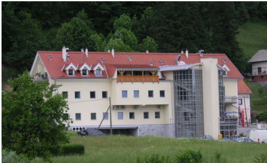
Slika 7: Aprila 2003 je bila v centru Gorenje vasi otvoritev novega poslovno stanovanjskega kompleksa. V stavbi so banka, pošta, mesarstvo, dva frizerja, bar in trgovina Mercator, v zgornjem nadstropju pa je pet zasebnih stanovanj.