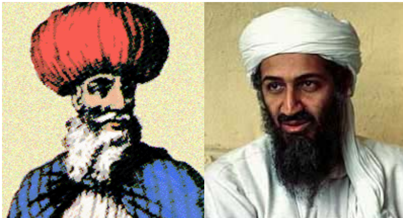
Slika 4.6.1.1: Levo- Hasan ibn Saba in desno- Osama bin Laden