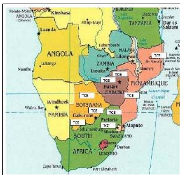
Slika 4.2.7.1. Prikaz razširjenosti TCE v afriških državah