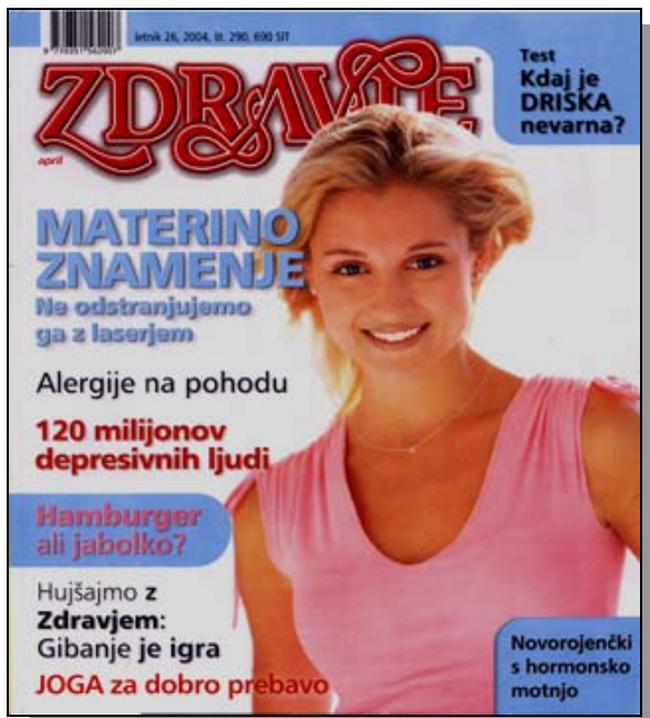
Zdravje, april 2004, 290. številka