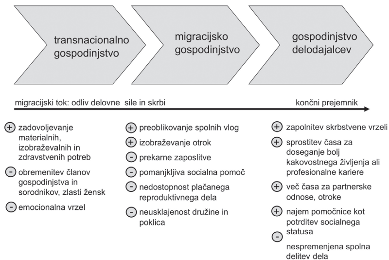
Shema 2: UČINKI GLOBALNIH VERIG SKRBI NA GOSPODINJSTVA

V shemi vidimo, da se pozitivni učinki kopičijo predvsem v končnem členu verige, pri prejemnikih storitev, pri transnacionalnih gospodinjstvih se pojavlja skrbstvena in emocionalna vrzel, pri migracijskih gospodinjstvih pa tudi druge oblike družbene neenakosti. 8 Primerjalno gledano je skrbstveni deficit manjši oz. so transformacije na področju skrbstvenega dela manj izrazite v nekdanjih komunističnih evropskih državah, saj migrantke z vračanjem v izvorno državo vzdržujejo kontinuiteto neplačanega reproduktivnega dela v lastnih družinah. Mednarodne delovne migracije žensk iz vzhodnoevropskih postkomunističnih držav, ki se zaposlujejo kot gospodinjske pomočnice ali oskrbovalke starih v zahodnoevropskih državah, so povezane s sistemom rotacije, ki migrantkam omogoča ne le optimizacijo možnosti za plačano delo, temveč tudi minizacijo ovir za opravljanje plačanega (v tujih družinah) in neplačanega (v lastnih družinah) dela. Sistem rotacije, ki ga vzpostavljajo in samoupravljajo migrantke po načelu solidarnosti,